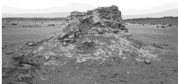
图2 被盗掘的旱峡沟南口建筑遗址

从覆盖土层中,发掘出形象比较完整的泥质彩塑残段,其中一件是佛头像彩塑,高8.5厘米、宽5.2厘米、厚4.5厘米,其脸型与大小皆如鹅蛋(图3—4)。一件肩至腰部的彩塑残件高7厘米、宽8.5厘米。结跏坐姿的残段,高5厘米、双膝间宽15厘米、前后宽11厘米。另有一件发髻和后脑、颈项已下都已损毁,但面部形象却相对较完整的人物塑像残块。此外,一件隆起较高的发髻彩塑残段,其下方还带有木棍骨架,通高8厘米、骨架高4厘米,下宽3.2厘米、发髻上宽6.2厘米、厚2.3厘米,发箍长4厘米、宽1.5厘米、厚2.5厘米,发髻表层有白色残留色块和淡墨色痕迹(图5),根据其发髻形状看