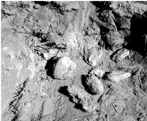
图3 遗址发掘出的彩塑残片