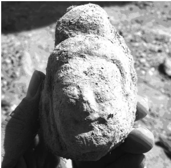
图4 遗址发掘出土的彩塑佛头像