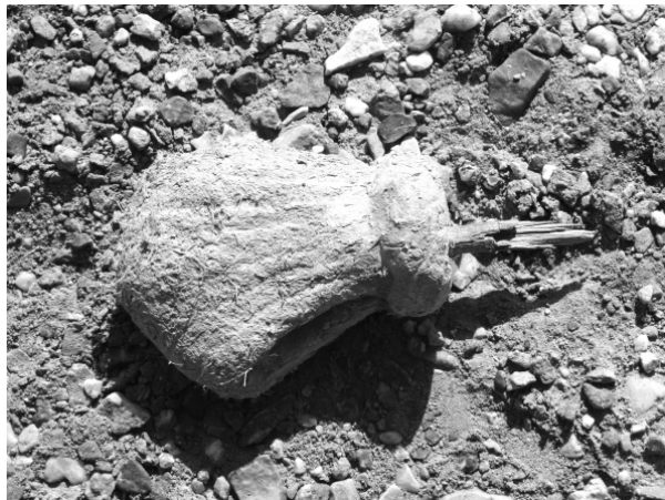
图5 遗址中发掘出的彩塑残段

上述彩塑作品,从它的人物造型特点可以看出与敦煌石窟艺术有着极为密切的关系。出土的彩塑