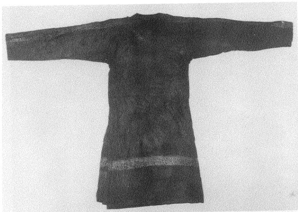
图3 黑龙江阿城巨源金代齐国王墓出土织金绢袍

细布。秋冬以貂鼠、青鼠、狐、貉皮或羔皮为裘,或作绞丝为绌。贫者春夏并用布为衫裳,秋冬亦衣牛、马、猪、羊、猫、犬、鱼、蛇之皮,或獐、鹿皮为衫。” [11]553 金人早期服饰多以动物皮或布为原料,没有华丽的装饰,等级制度不是很严格,服饰未成定制。到熙宗时,天眷二年(1139)始定仪制,“初御冠服” [14] 。皇统元年(1141)正月“初御袞冕” [14]74 。遵中原古制准王公等服降龙纹饰,其宗室、外戚、一品命妇等亦曾经宣赐云肩龙纹黄服。从世宗大定七年(1167)始金国罢改龙纹,“(宗室及外戚并一品命妇)又禁私家用纯黄帐幕陈设,若曾经宣赐鸾舆服御、日月云肩、龙文黄服、五个鞞眼之鞍皆须更改” [15] 。说明金世宗罢改龙纹之前的贵族命妇服饰中使用日月龙纹饰物的云肩。《金史·舆服志》卷47载:“(金人常服)其衣色多白,三品以皂,窄袖,盘领,缝腋,下为襞积,而不缺袴。其胸臆肩袖,或饰以金绣。” [15]948 则金代不仅贵族妇女服用云肩,男子常服中也服用云肩。黑龙江阿城巨源金代齐国王墓出土了一件男式酱色地织金绢绵袍一件,盘领,窄袖,两袖通肩有织金袖襕两行,两行图案间为织金圆珠纹 [16] (图3)。说明金代云肩是指两肩和胸背及袖子上的装饰物。日本学者曾对黑龙江省阿城亚沟石刻图案有过详细的描述:“此武士身著胡服,头戴盔,右手握鞭,足著长靴,可谓其全副武装矣……胡服之衿较广,全身皆有装饰之花纹,两肩之部分露有高贵披肩之两端,自胸部以迄两腕之上部,亦隐约可见花纹。” [17] 可见金代从贵族男女到武士都有服用云肩者。金人张瑄所画《文姬归汉图》中的人物是按女真人的形象画的,图中文姬身穿窄袖圆领袍,外罩半袖直领袍,颈项间围有云肩,脚穿长靴(图版13)。她肩上所披云肩的形制为四垂云式,与袍服不是一体的,是围于