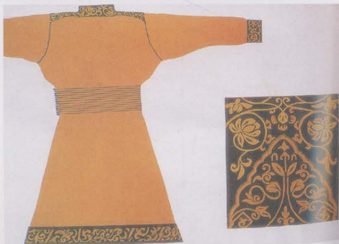
图版14 元代织金锦袄子 新疆盐湖古墓出土