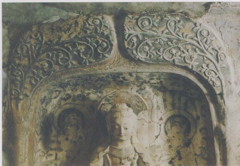
图版16 第275窟双树龕龕楣图案