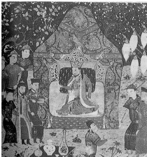
图2 波斯画《旭烈兀汗在沙弗尔罕》

的云肩形制多呈四垂云式,与文献记载完全相符。新疆盐湖古墓出土了一件元代流行的黄色油绢织金锦边袄子,此袄子袖口及领、肩部有用织锦做成的边饰,至今仍可见金线光泽 [9] ,此服两肩及领子上有金锦制作的纹样,但胸背未饰纹样,不是严格意义上的四垂云式。由此可知,蒙元时期袍服上的装饰虽以四垂云式为主,但也有非四垂云式只是在两肩或领口周围饰有纹样的现象。