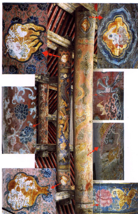
4. 大殿东次间西缝东立面及局部大样