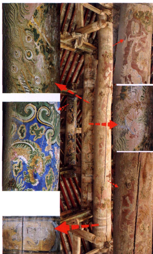
1. 绘殿东次西缝东立面及局部图样