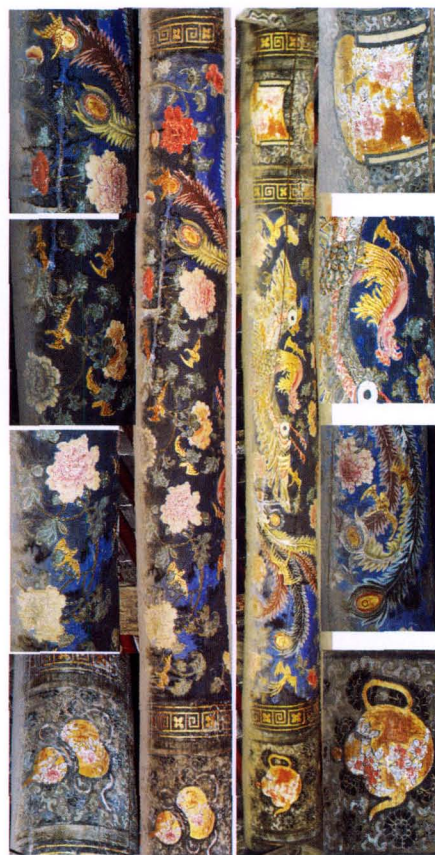
3. 大殿五架梁双立面及局部图样