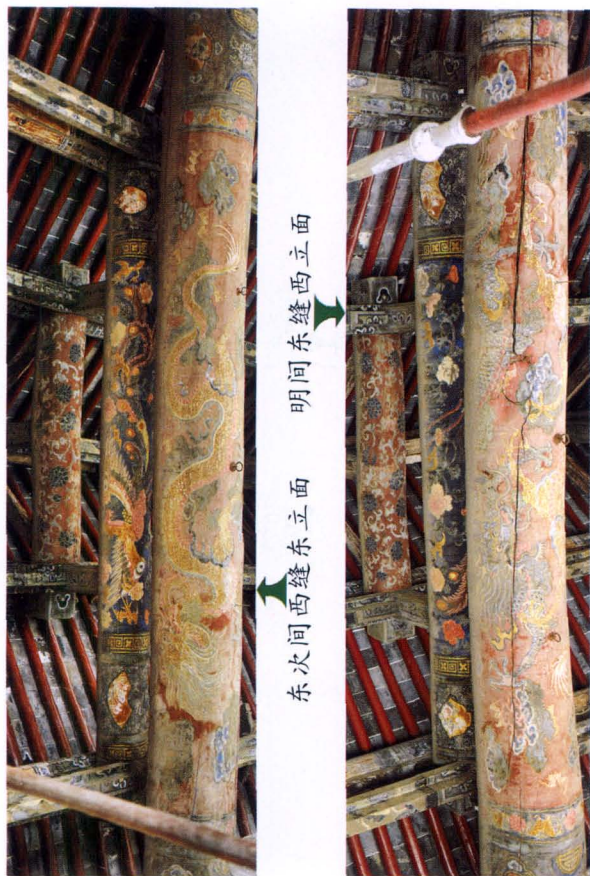
东次间西缝东立面 明间东缝西立面