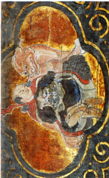
大殿梁架开光及聚锦图样