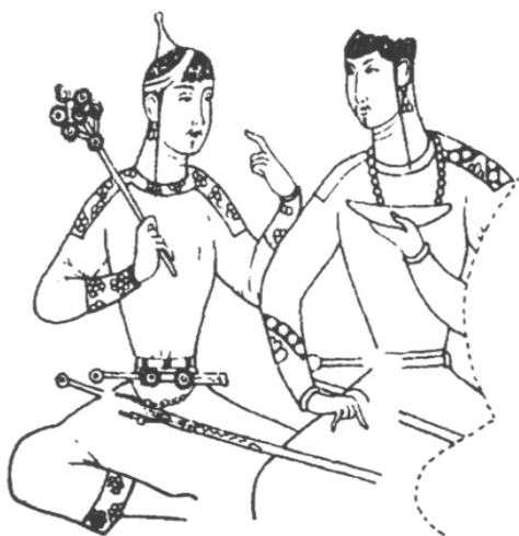
图五 片治肯特壁画上的粟特贵族形象