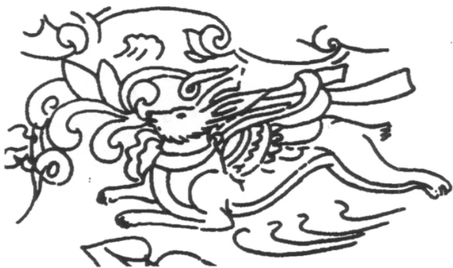
图二 傅家画像石第七石中 Sēnmurv 形象(郑岩绘图)