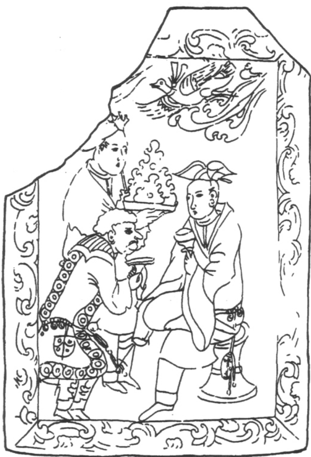
图一 山东青州傅家画像石第二石《商谈图》(郑岩绘图)

征,以及短发与服饰形制,可以确定其为粟特商人。粟特人是中亚印欧人种,中国古代称其为“昭武九姓” [4] 。在中古时期粟特人是欧亚大陆丝绸之路上居于贸易霸主地位的商业民族,他们长期对北朝至隋唐的中原王朝和各突厥系政权的政治、经济、文化发展施加着影响。甚至粟特语(Sogdian Language)也成为了突厥汗国的官方语言,以及陆路丝绸之路上的国际通用语言 [5] 。