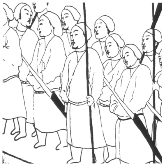
图四 太原王家峰北齐墓墓道西壁仪卫图(郑岩绘图)

北齐是由激烈抵制北魏汉化政策的鲜卑顽固军阀势力建立的政权,但因其在地域空间处于北魏政治、经济与文化活动运行的核心地域,在国统上又脱胎于北魏延脉的东魏,故又被后世认为是汉化颇深的北魏国家文物制度的直接继承者,其文化水平远高于在西面对峙的同样国家性质的北周。北齐这种矛盾的国家性质必然对当时社会与文化的方