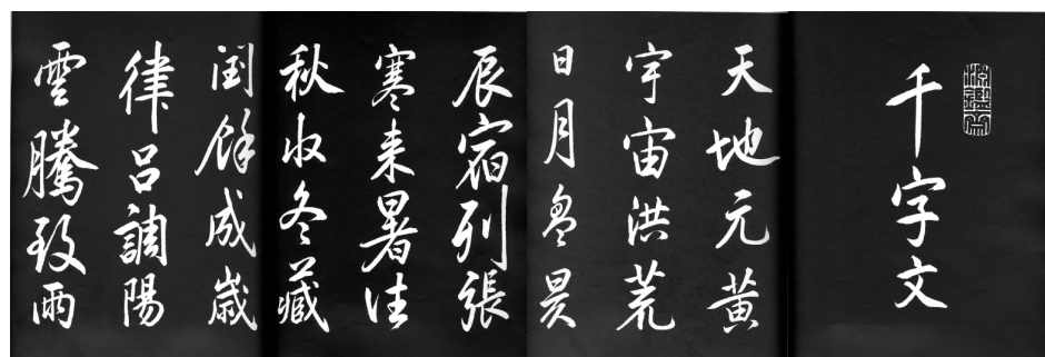
图三 康熙皇帝手书《千字文》拓本