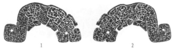
图五// 第五等级的越国玉器(苏州大真山出土)