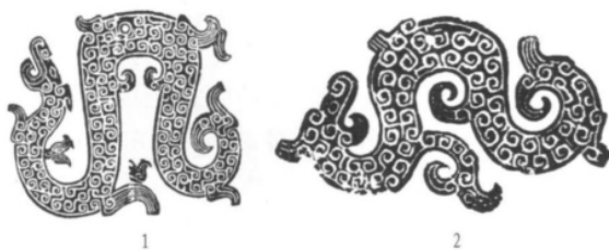
图三// 第三等级的越国玉器(安吉龙山出土)