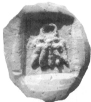
图一 高陵铜印印文橡皮模

唯其上部所从的“圆圈状”, 则与“𠂔”字所从的“廿”略有区别。《说文·𠂔部》说: “𠂔, 平也。从廿, 五行之数二十分为一辰。从