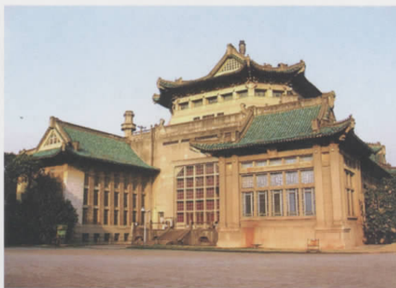
图一 武汉大学图书馆旧址