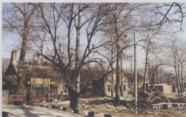
图十二 香山慈幼院外景