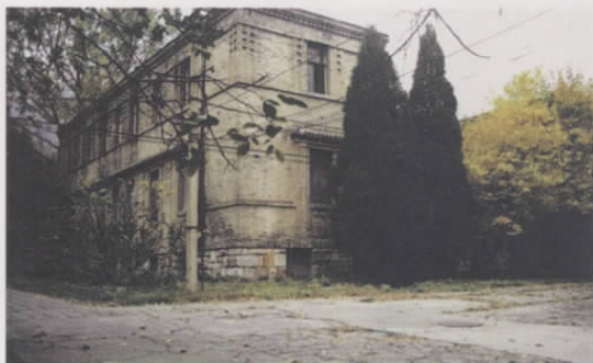
图九 香山慈幼院图书馆楼外观