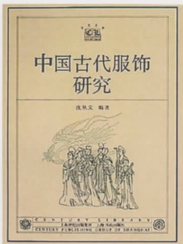
图八 《中国古代服饰研究》