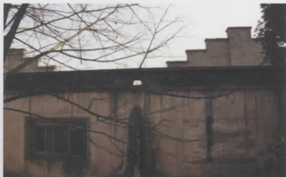
图十 香山慈幼院图书馆