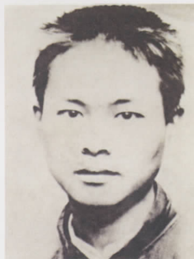
图二 22 岁时的沈从文