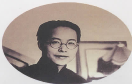
图十一 1933 年写《边城》时的沈从文