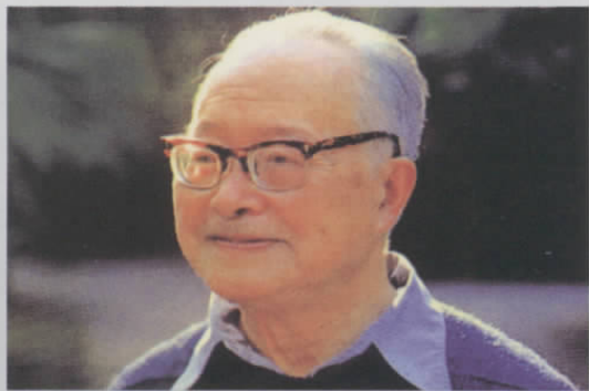
图十三 老年沈从文