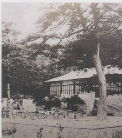
图三 香山慈幼院办公楼