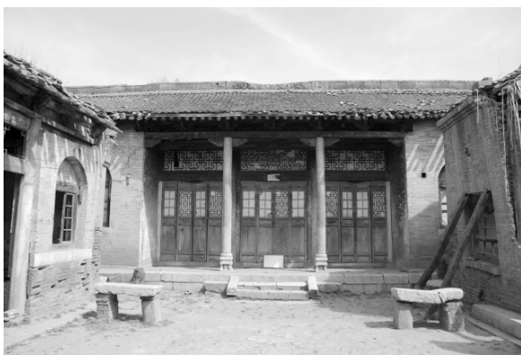
图二 四合院隔扇门槛窗