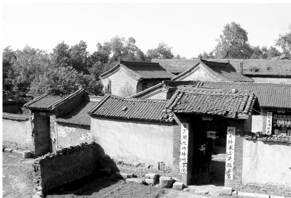
图一 申家二十四院鸟瞰

所谓“棋盘院”就是由两个三合头的院落合成的一座大四合院, 在院子的中间不是设有厅房或腰墙, 而是用横墙相隔, 前为大门, 后为正房, 横墙中门饰垂花门楼, 如同棋盘中“楚河汉界”,