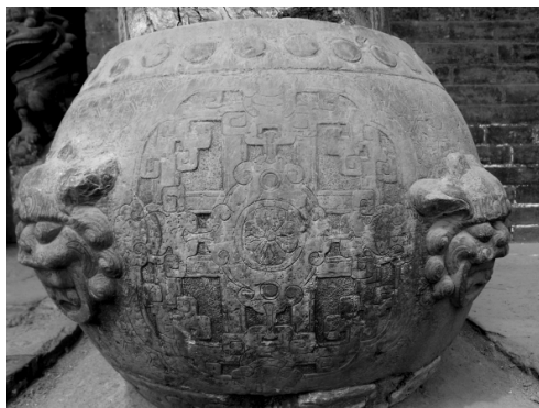
图一 常氏宗祠过二道门门前柱础

常家庄园的柱础主要以圆鼓形为主,重要建筑部位的柱础直径是柱身的 1.5 倍以上,每个院落房屋的柱础纹样各有特色,变化丰富,大多都是吉祥寓意的图案。圆鼓形柱础都以青石为主,造型手法以浅浮雕和线刻为主。圆鼓形柱础中最为精美的是宗祠二门前的柱础,柱高 40 厘米,直径 55 厘米,柱础腰间雕有四只狮头,面向东北、