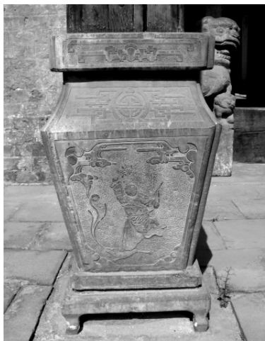
图五 贵和堂新院二门柱础