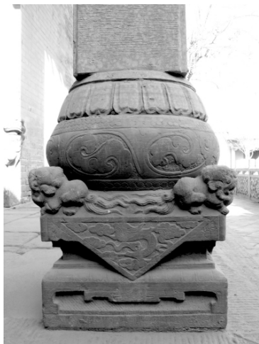
图七 养和堂大门狮座鼓墩柱础

牡丹,牡丹色绝天下,具丰腴之姿,有富贵之态,被称为花中之王,在中国的传统文化中被视为繁荣昌盛、幸福和平的象征,又被称为富贵花。