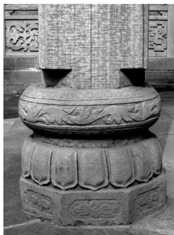
图六 石半亭六方垒鼓柱础