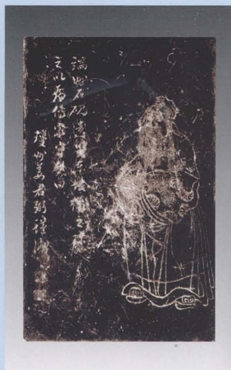
2. 砚台反面苏东坡造像