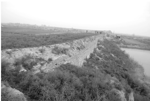
图三 蒲州城墙遗存