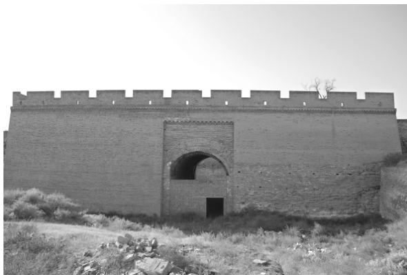
图四 蒲州城墙外侧女儿墙

年(1816年)、同治七年(1868年)修建皆基于明洪武四年(1371年)蒲州城的形制(图二)。