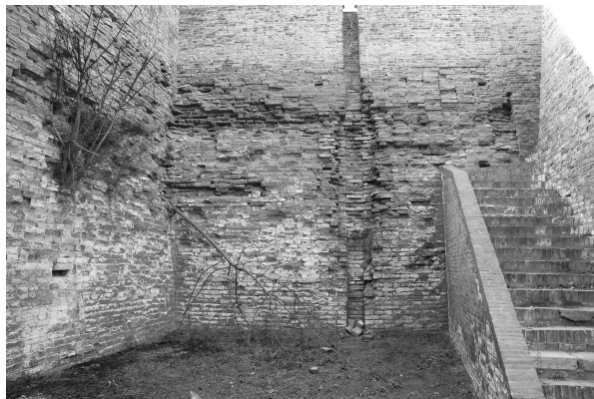
图五 蒲州城排水明沟

明洪武四年(1371年),张盖重筑蒲州城,“城高三丈八尺,堞高七尺” [3] 。嘉靖三十四年(1555年)复筑时,“垒高三丈” [4] 。至隆庆元年(1567年)重修时,“城上女墙高五尺,阔四尺,间隔四尺五寸” [5] 。现外城土城墙,残高0.4~12.5米,顶宽0.3~8米,墙基宽5~16米,夯土层厚0.10~0.15米。内城包砖墙,残高1~12米,顶宽0.3~9米,墙基宽5~15米。城墙广厚、中坚,足以御敌。城墙上部女儿墙内外有别,外侧女儿墙(图四)设垛口,墙高2.17米,厚0.6米,间有射击孔、瞭望孔、炮口等军事防御设施;内侧女儿墙高0.76米,厚0.38米 [7] 。内侧女儿墙,可保证城上士兵的安全;外侧女儿墙的高度完全能够掩护守城的将士,墙上方形垛口可供士兵投掷滚石、檣木打击敌人,瞭望孔可观敌情,射击孔、炮口可痛击来敌。此外,城墙内侧有青石板铺墁的上城马