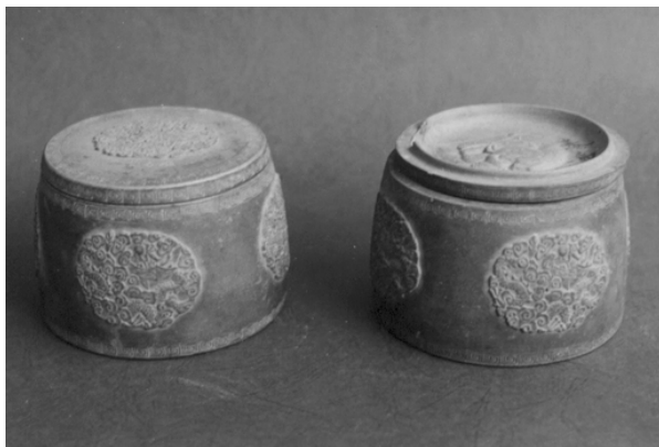
图二 杨彭年宜兴澄泥蚩蚩罐

6.9 厘米,重量 480 克。另一件底径为 11 厘米,口径 10 厘米,高 6.6 厘米,重量 470 克。它们均为圆形,厚圈足,上小下大,坐盖式。装饰纹:盖边沿、罐上、下部位饰回纹,盖的中间部分与罐的中间部分(器身),浮雕团龙和如意纹云海图,造型古朴典雅(图二)。