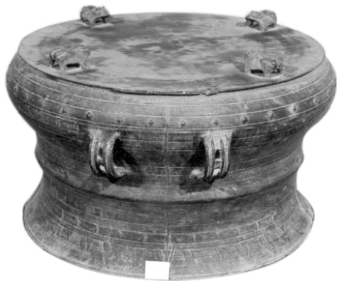
图三 仿制扁系双耳腰鼓式铜鼓

铜鼓长期流行于我国南方一些省市以及东南亚一些国家,而云南是古代铜鼓出土较多的地区之一。从春秋战国时期开始出现,汉代广泛使用,一直沿用到明、清。据调查,我国现存铜鼓约数千面。中国铜鼓研究会把它们分为八个类型,即万家坝型、石寨山型、冷水冲型、遵义型、麻江型、北流型、灵山型和西盟型。其中万家坝型铜鼓因出土云南省楚雄万家坝而得名,流行时间大致在公元前 7 世纪,是迄今发现的世界最早的铜鼓类型。云南地区发现的春秋至汉代青铜器,在冶