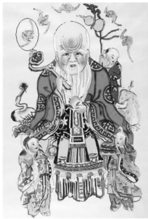
图一一 年画上的蝙蝠图案

1. 福禄寿: 寿星手持杖,牵鹿,杖头挂葫芦,手捧仙桃,身旁有几只蝙蝠飞舞。蝙蝠取其谐音“福”,鹿取其谐音“禄”,葫芦取其谐音“福禄”寿星,仙桃象征寿。福、禄、寿在民间流传为天上三吉星,福寓意五福临门,禄寓意高官厚禄,寿寓意长命百岁。中国民间将三星作为礼仪交往和日常生活中象征幸福、吉利、长寿的祝愿(图一一)。