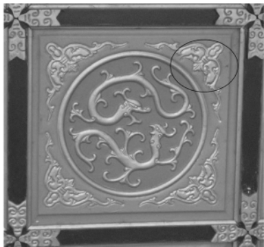
图四 宝墨园内屋顶的蝙蝠图像

图案。如在屋檐（或门框上）有 6 处有蝙蝠图像石雕、10 处木雕，屋顶有 7 处有蝙蝠图像（图四），围栏有 1 处石雕，墙壁《七仙女彩绘》上有蝙蝠图像。特别值得一提的是，正对大门的《吐艳和鸣壁》巨型砖雕画上有蝙蝠图案 56 处（图五）。