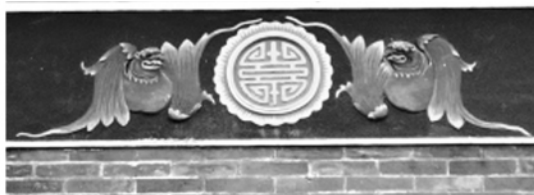
图二 陈家祠灰塑“福寿双全”上的蝙蝠