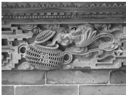
图五 宝墨园内屋顶的蝙蝠图像

在余荫山房共发现 27 处蝙蝠图案，在屋檐有 3 处蝙蝠石雕、3 处木雕，屋内墙壁上有 4 处