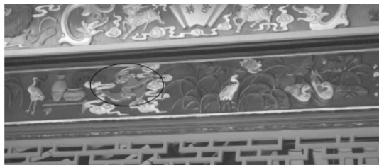
图二四 宝墨园屋檐上的蝙蝠图案

4. 天降鸿福：如余荫山房屋檐灰雕上的蝙蝠图案（图一三）、宝墨园屋檐上的蝙蝠图案（图二四）。