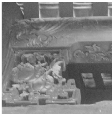
图二一 余荫山房屋梁上的图案示“洪福无量”