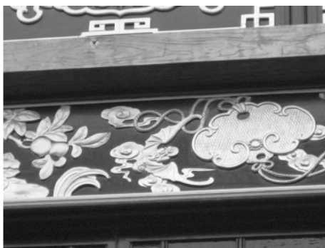
图一五 宝墨园屋檐上的“福寿双全”图案

8. 钟馗引福: 钟馗手挥利剑, 前有蝙蝠飞舞, 象征钟馗驱邪接福, 祈求富贵、平安、吉祥 (图一〇)。