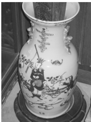
图一九 陈家祠花瓶上的福善吉庆

12. 福善吉庆：童子手持扇子、戟、磬，旁有蝙蝠飞舞，扇子取其谐音“善”，戟取其谐音“吉”，磬取其谐音“庆”，象征福善吉庆（图一九）。