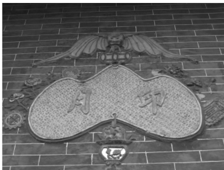
图二六 余荫山房壁画上的蝙蝠图案