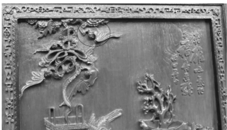
图八 陈家祠内屏风上“五蝠献寿”的蝙蝠图案