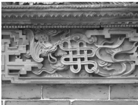
图二〇 宝墨园《吐艳和鸣壁》砖雕“福寿绵长”图案

17. 历元五福：以荔枝、桂圆或铜钱和 5 只蝙蝠构成。旧历以冬至为一岁之始，平朔为一月