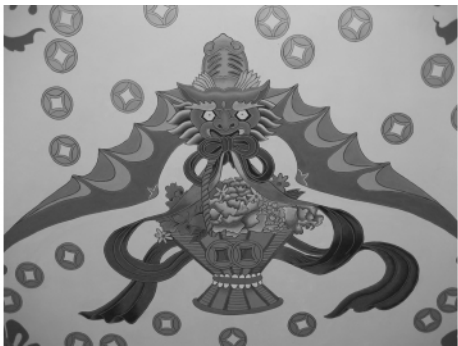
图二五 宝墨园屋顶上的蝙蝠图案

5. 福在眼前：此类图案在 3 处南粤建筑中很多，如陈家祠石雕上的蝙蝠图案（图三），宝墨园屋檐上的图案（图一四）、《吐艳和鸣壁》砖雕上的蝙蝠图案及屋顶上的图案（图二五），余荫山房壁画上的蝙蝠图案（图二六）。