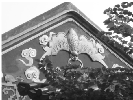
图一三 余荫山房屋檐灰雕“天降鸿福”

6. 福在眼前: 蝙蝠衔古钱, 蝠取其谐音“福”, 钱取其谐音“前”, 钱有孔眼, 象征福在眼前 (图一四)。