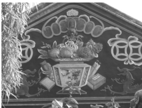
图二七 余荫山房屋檐灰雕“福寿双全”