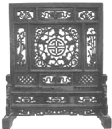
图一二 宝墨园藏清代“五福献寿”屏风