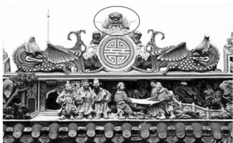
图一 陈家祠屋顶砖雕上的蝙蝠图案（圆圈内，下同）