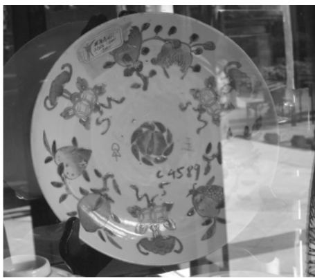
图二八 陈家祠瓷盘上的蝙蝠图案