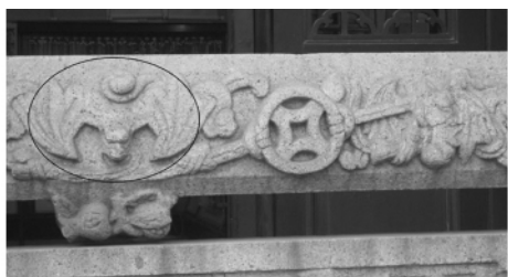
图三 陈家祠内围栏石雕上的蝙蝠图案

图案。如在屋檐（或门框上）有 6 处有蝙蝠图像石雕、10 处木雕，屋顶有 7 处有蝙蝠图像（图四），围栏有 1 处石雕，墙壁《七仙女彩绘》上有蝙蝠图像。特别值得一提的是，正对大门的《吐艳和鸣壁》巨型砖雕画上有蝙蝠图案 56 处（图五）。