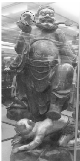
图一〇 宝墨园藏明钟馗引福立像