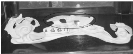
图七 陈家祠内清代木如意上的蝙蝠图案

物中也有蝙蝠图案,如清代蝙蝠彩瓶 2 处(图九)、明清及近代玉器有 6 处,明代钟馗接福立像有 1 处(图一〇)。