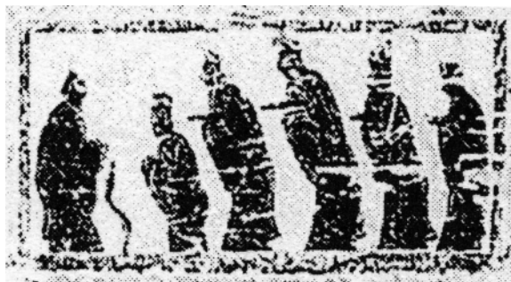
图二 山东嘉祥武氏祠西阙南壁孔子问礼图