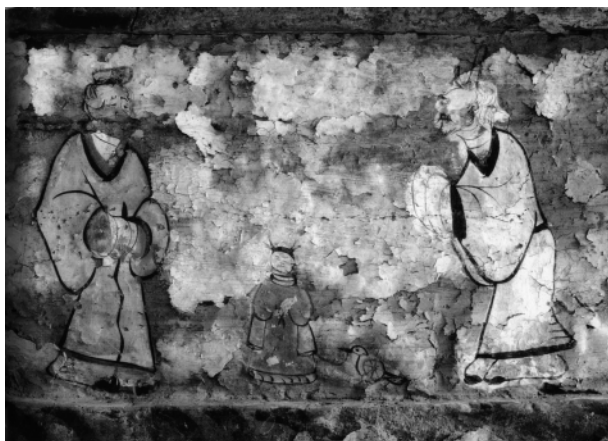
图三 陕西靖边杨桥畔东汉墓前室东壁梁枋孔子问礼图

从发掘报告和相关报道来看,这几座壁画墓大致属于西汉晚期至东汉晚期。和林格尔1号壁画墓属东汉晚期,上限不会早于永和五年(140年),下限不晚于二世纪60~70年代;杨桥畔1号墓为东汉时期;老坟梁42号墓属西汉晚期至新莽时期;渠树壕1号墓为新莽时期;东平1号墓属东汉早期。另有资料显示,杨桥畔发现的6座壁画墓,时代均为新莽时期,说明陕北地区与内蒙古中南部同属汉代壁画墓的集中分布带。