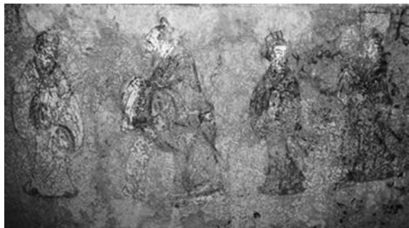
图一 山东东平汉墓壁画孔子问礼图