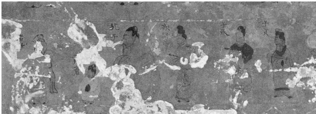
图五 内蒙古和林格尔汉墓壁画孔子问礼图

上述壁画墓的时代推断,有的是依据墓地发掘墓葬的整体分析,有的是基于出土陶器和墓葬形制判断,还有的是根据墓葬结构规模、出土器物以及榜题文字内容而定。除了和林格尔1号墓推定为东汉晚期以外,其余大部分定为新莽时期,甚至更早到西汉晚期。