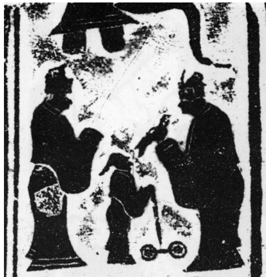
图四 陕西绥德刘家沟东汉画像石孔子问礼图

从绘画艺术表现手法来看,无论画面布局、装饰效果亦或人物造型、运笔着色等均显得较为稚拙,反映了作为我国早期绘画艺术阶段的汉代在绘画艺术发展上的历史现实。在这类构图样式中,对人物形象的刻画表现的比较成熟,如对稚童项橐的描绘相当生动。壁画着色中虽然出现了少量晕染技法,但大多表现为线条化的轮廓造型。如杨桥畔壁画墓、老坟梁42号墓等以青