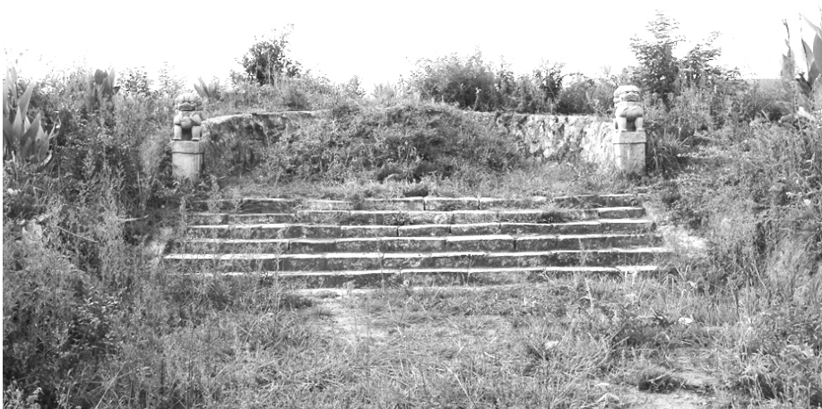
图四 朱弼墓坟冢部分

朱弼墓地呈窄长形，坐落在自北向南缓缓而下的坡丘上。南北（由封土至神道碑距）长103.2米，东西宽25.6米，占地面积2642平方米。几经沧桑，墓地已非尽原貌。神道埭地石板在文革期间已遭破坏，罗围部分砌石属后来修复。罗围内平列封土，封土高1.05米，径长3.7米。20世纪70年代兴修水利时，当地农民利用墓地的坡洼，在墓地中部曾横筑土堤而形成一口水塘，2006年墓地已恢复原貌。庆幸的是至今还保存着一批花岗雕刻造像，牌坊、神道碑等附属文物保存也较为完好（图四）。