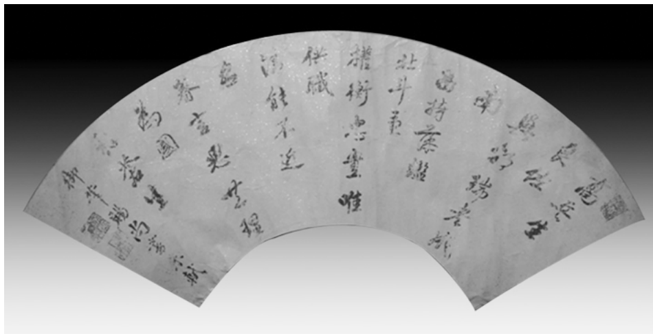
图二 乾隆御赐朱轼扇面

朱轼对朱熹、程颐的学术研究尤为情深，曾取朱熹的《易本义》和程颐的《易传》，在内容互相有异同的地方以参照校正，不重复模棱两可的说法，统一解释意义，在保存各家的评论基础上，并附录自己的评判与见解。著有《周易传义》十二卷（《钦定四库全书总目提要》）。乾隆皇帝览其书后，曾在扉页挥笔瀚墨称道：“简而当，博而不支钩，深探顾而不险地，盖玩之渊，故择当也精，体之技，故哲理也贤。”（《四库总目提要》）（图二）。