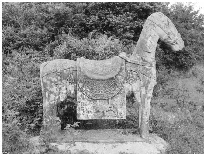
图九 朱軾墓神道石雕马