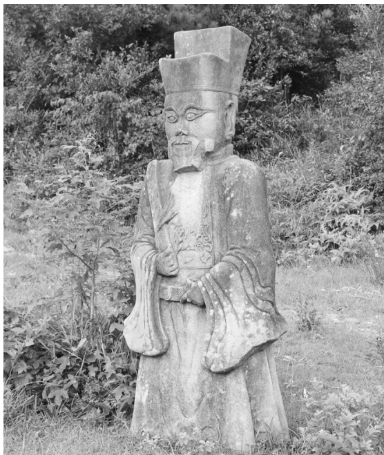
图一一 朱軾墓神道石雕文臣俑