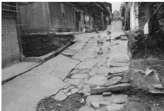
图二 民建下街子水泥路面下的石板

顺江村原名吹十铺，这是当地村民写给我们的名字，但是我觉得应该叫“炊食铺”才是。从时间上算，一大早负重从菁口村走到这里，也该做饭吃了。背夫们往往出发时就会背上一斗粮食，沿途都是自己煮自己吃。这条老街有的房子外面包着砖，但里面还是老的梁架，路面上铺了水泥，比较平坦，原来的石板路面就看不见了。