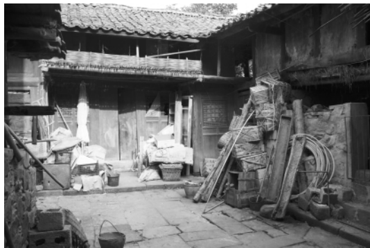
图三 宜东后街的小院

东非常繁华，藏人的马帮和内地的背夫来来往往，热闹非凡。现在还有五省庙，据说是用陕西等五省商人修会馆后剩下的钱修的。此外还有曾家院子、罗家院子、彭家院子等马店。