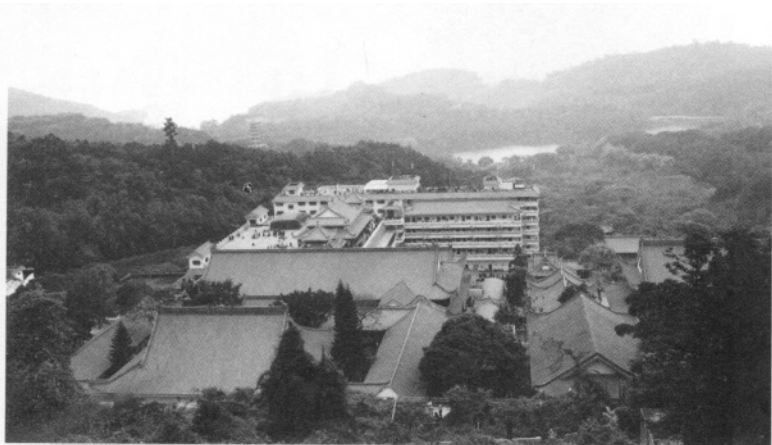
梧桐山中的弘法寺

并祈不吝慈悲仍回娑婆,广度有情。四众弟子以不同方式寄托哀思,一位居士拟了一副对联:本来乘愿,以普贤行,难行能行,众善奉行,度化人间;焕发觉悟,现寿者相,相本无相,无住空相,利乐有情。