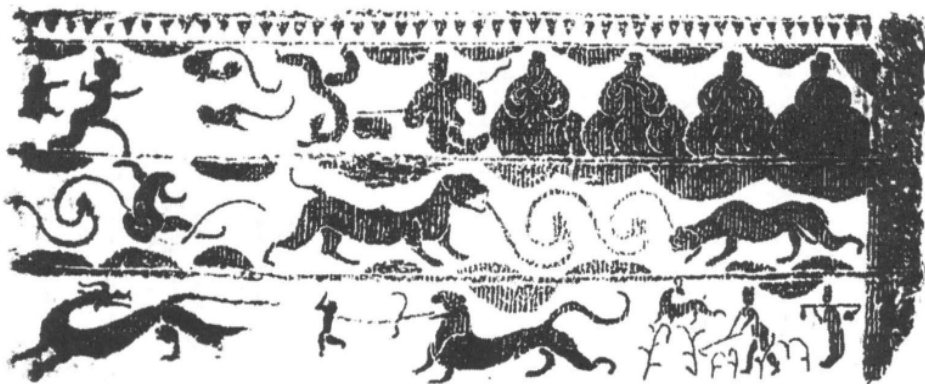
图四 宴乐·逐疫·耕耘