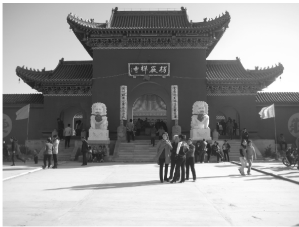
图二 新建楞严寺山门

(3) 公园部分。寺院、广场的四周为公园部分。以自然地形为基础,广植花木,形成花果山,桃花岭,佛光洞,花鸟园,楞严塔(待建)等景点。各景点由小径连通,建有供休息的观景小亭。楞严寺外还修筑了宽阔的大道,见图四。