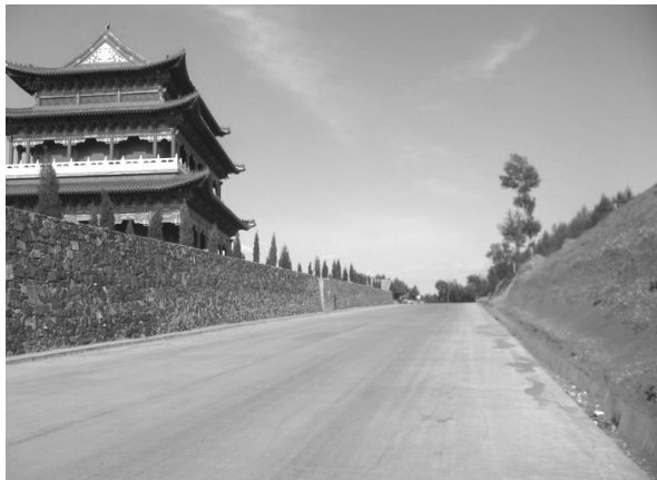
图四 新建楞严寺藏经楼外景及寺外的宽阔大道