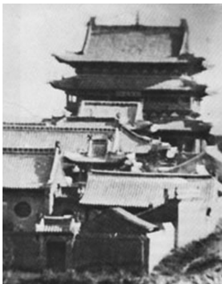
图一 左云原楞严寺局部(摄于20世纪40年代) 图中后面最高的建筑是“藏经阁”

的护法(民间称亨哈二将)。穿过山门即是前院。前院正面是天王殿,砖砌悬山顶式,内有四大天王神像。天王殿两旁钟、鼓楼各一,钟、鼓二楼四角翘起,屋檐、斗拱多施雕刻。前院两边是主持僧人的斋舍。