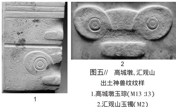
图五// 高城墩、汇观山 出土神兽纹纹样 1.高城墩玉琮(M13 :13) 2.汇观山玉镯(M2)

梁、鼻等细部的位置与反山 M12 :93、M12 :96、M12 :98 琮上神兽纹几乎相同,属于反山样。其与反山墓地的密切关系,也显示汇观山墓地在良渚社会不一般的地位。