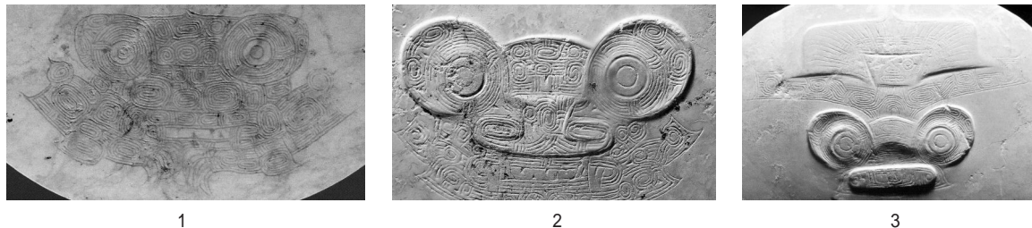
图二// 反山墓地玉器局部纹样

再看瑶山墓地神兽纹纹样的特点。瑶山墓地神兽纹纹样有两种不同风格:A类是在神兽纹所在的玉器面上都满刻底纹,细刻线顿挫,构图疏朗,眼梁部位有宝盖结构,兽眼两端有眼角。此类纹样在瑶山各时期的墓葬都有,如M3:3、M9:1、