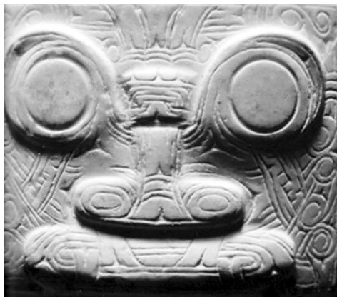
图三// 瑶山墓地玉器A类纹样

M9 :4、M10 :6、M10 :15、M10 :19、M10 :20、M11 :64、M11 :86、M12 :2789等玉器(图三)。B类仅在神兽纹的身体部位添加底纹,如M12 :2784、M12 :2786、M12 :2788、M2 :1、M2 :22、M7 :34等玉器。B类纹样出现时间晚于A类,在瑶山晚期的M12中两类纹样的玉琮共存。B类纹样可能是受反山样细密刻纹风格影响而产生,但仍然保留了瑶山A类神兽纹纹样圆圈纹刻线较粗,兽眼两端仍有眼角等特点。B类纹样圆圈底纹在神兽身体各部位的位置和构图等细部特征也与反山样明显不同。我们把瑶山墓地出土的这两种风格的神兽纹纹样分别称为A类瑶山样和B类瑶山样。