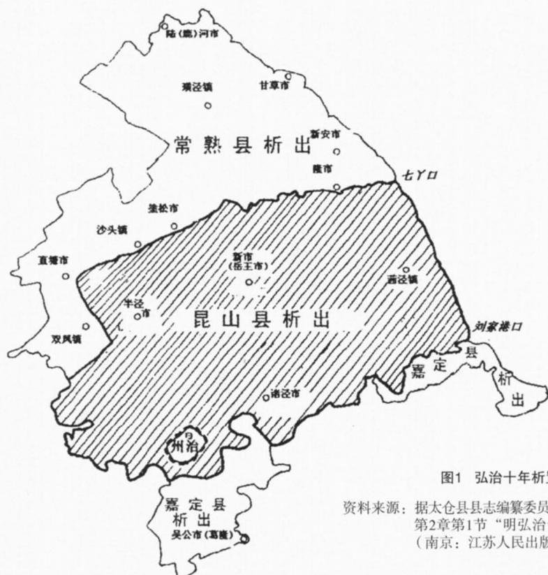
图1 弘治十年析置太仓州示意图