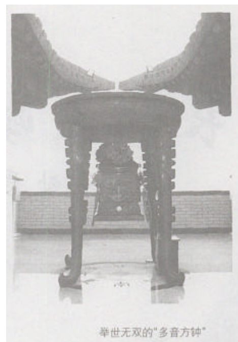
举世无双的“多音方钟”

华门顶部的阁楼叫“门祖阁”，陈列着中国的“门祖”和“门神”文化。阁楼南北大门各有一副门文化对联，北侧为“开开闭闭一瞬间，进进出出五千年”，南侧为“进出有道勿忘思门祖，起居安身何不惜门神”。阁楼内位于东侧的雕像是中华民族的“门祖”有巢氏，西侧展示的是中国古老的“门神”文化。阁楼中央是一尊青铜八卦愿珠，借中国阴阳八卦文化和门祖门神之灵气，游人可旋转分布八个方向的愿珠，寄托对天、对地、对国、对家、对人、对事的美好心愿。在华门的最高处，置放于平台中央的是一尊举世无双的“多音方钟”，该钟的发明是我国历史上钟器制造的创新，堪称华门独有的传声之宝。登高击钟，心悦神