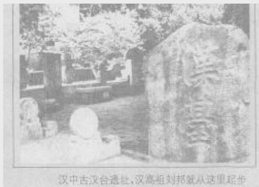
汉中古汉台遗址,汉高祖刘邦就从这里起步

大约在公元前175年春天的一天,张骞出生在陕西汉中城固县城西南紧靠汉江一个叫白崖村的地方。张骞家中人口不多,说起来还是个独生子,因他的弟弟张敖是其父在路旁捡的。由于家境不算宽裕,张骞自幼除了在私塾读书外,其余时间就在农田里劳作,在汉江里捕鱼,倒也使自己的体质得到了很好的锻炼。后随父外出经商,货船翻沉,惟张骞一人生还,加之未婚妻又被债主逼得投了汉江,悲痛之余,遂萌生投军杀敌的想法。公元前156年夏,张骞与几个同伴应招入伍,在名将李广将军率领下,投入了反击匈奴的战争,由于作战骁勇,被李广调至帐前任左常侍。入伍10多年后的汉武帝建元元年前后,位列朝廷郎官。