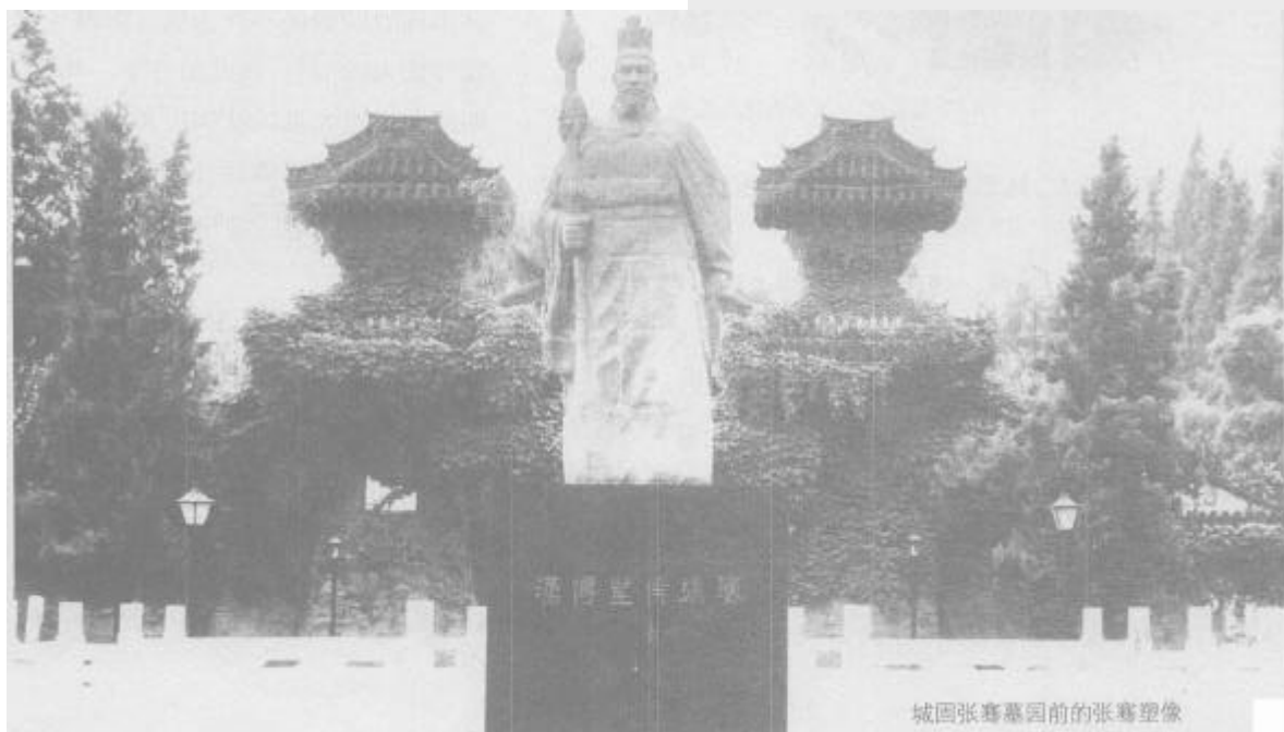
城固张骞墓园前的张骞塑像