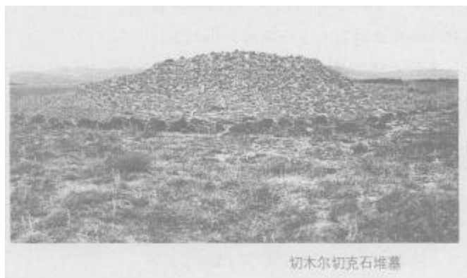
切木尔切克石堆墓

217 国道驶向距市区 17 公里的切木尔切克乡，向草原深处驶去。此处是山间盆地，地域辽阔，地势较平坦，车子在坑坑洼洼的草地上缓慢地行驶约 10 公里后，几处并不高大的土堆墓映入眼帘。下车后我们站在墓堆上放眼四望，能看到的古墓只有五六座。切木尔切克古墓群分布在这方圆数十平方公里之内，由于地势略显起伏，远一些的古墓就看不到了。我们驱车在这里转悠了一天，看遍了所有的古墓，大概有 30 余座，有一些已几乎与地表平行，墓间杂乱地布满了石块，可明显看出人为堆起的痕迹，其中有十几处墓葬露出了石棺。