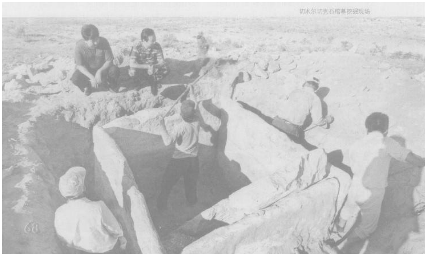
切木尔切克石棺墓挖掘现场