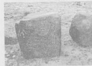
切木尔切克墓前的石人