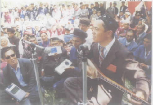
阿肯歌手弹唱着精彩有趣的民间故事