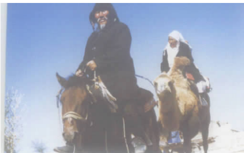
老夫老妻在行程中互相关心