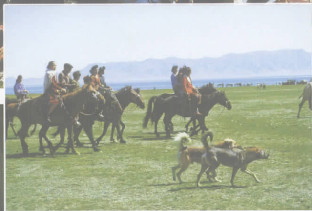
哈萨克牧民举行摔跤、姑娘追、赛马等活动