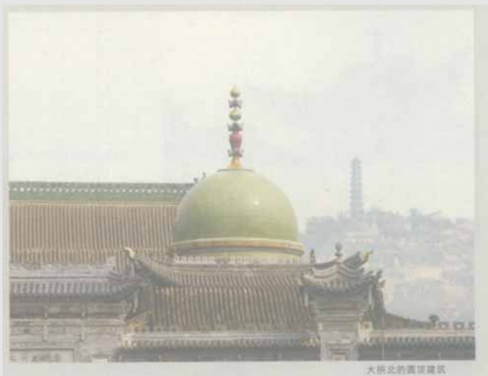
大拱北的清真建筑

红园是临夏州解放后修建的第一个公园。红园先声夺人的地方是由八根朱红色立柱挑起的木叠式建筑牌坊门，是无过梁的一字形牌坊，高大恢弘，在园林牌坊建筑中独树一帜。