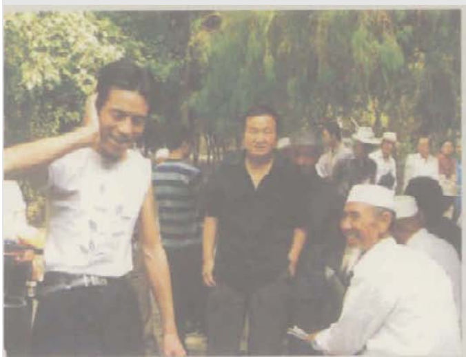
在临夏体育场，一堆人不分男女老少在漫“花儿”

而在此时，在临夏体育场，一堆一堆的人不分男女老少，聚成一个个圆圈，其中一个人漫上几句，另一个人接着再漫。或许是在城里，声音并不大，但那音调却有一种极强的穿透力，能钻到城市的每个角落。对于一个外来的行者，歌词是绝无可能听懂的，但你无法拒绝那悠扬的音调，拉着你靠近那漫着“花儿”的人群。