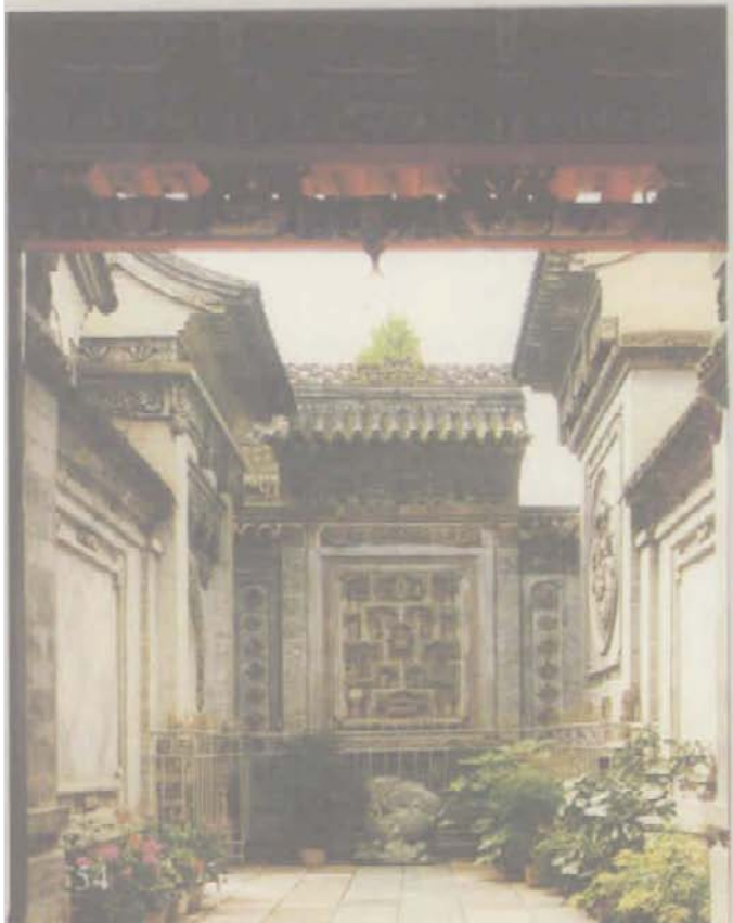
庭院深深， 砖雕几许

当然，歌词我是听不懂的，是朋友帮助我记下的。但那好像要撕破晚霞的声音是我永远不会忘记的。