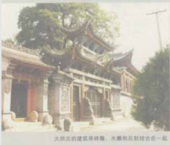
大拱北的建筑将砖雕、木雕和石刻结合在一起

步过垂柳轻拂的幽径，便是清晕轩，因为整个亭轩南北呈一字排开，当地人也称为一字亭。一字亭给人的印象是以红、黄色为主调的色彩绚丽的彩绘，看上去也极为华美。其实一字亭在建筑上集汉族木刻、回族砖雕和藏族彩绘为一体，整个建筑巧妙而完美地结合在一起。而最让临夏人炫耀的是南北两侧照壁上的砖雕。南侧照壁上的砖雕名为“泰山日出图”，画面上的主要内容是两峰巍峨对峙，峭拔挺秀，中间石径奇险，逶迤曲折，更有宝塔耸立，泉水淙淙，崇阁朝阳，轩窗当风。面对这幅艺术珍品，似有身临其境、心旷神怡之感。北侧照壁上的一帧砖雕名为“石榴双喜图”，画面上石榴树枝繁叶茂，果实累累，一对喜鹊似已饱尝了那珍珠似的石榴，正在举起一只爪子，擦去尖喙上的残汁。高明的构思，精湛的雕工，把生动的画面和传神的意趣淋漓尽致地再现在几方青砖之上，令人叫绝。