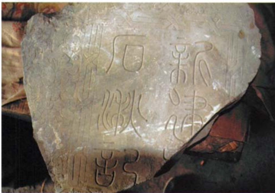
北联池出土的石碑残片