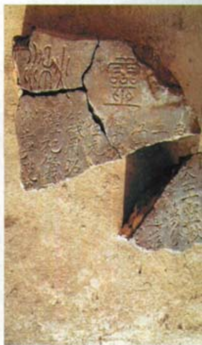
北联池出土的元代祈雨立碑断片

伏羲，那仙女是华胥氏，北联池就是“雷泽”，这一系列的疑惑如同涨潮的海水一浪接一浪地拍击我的心头。但有一点是毋庸置疑的，即六盘山、北联池和人文始祖伏羲有着某种密不可分的关联。