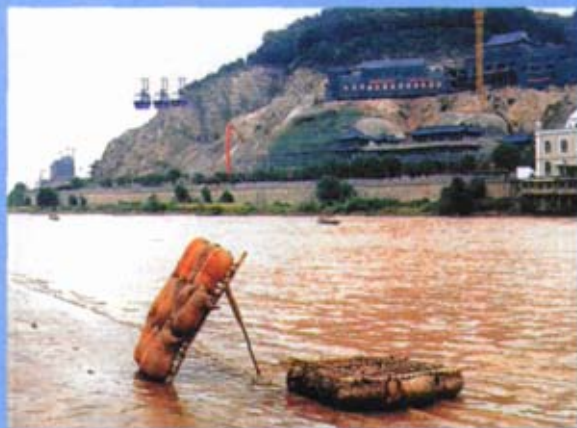
黄河铁桥附近，筏子、索道、汽艇，渡河工具一个也不能少

鞘岭，进入河西走廊。由于金城与河西只是一河之隔，所以历史上的金城一度也归河西凉州所辖，史称河西五郡。