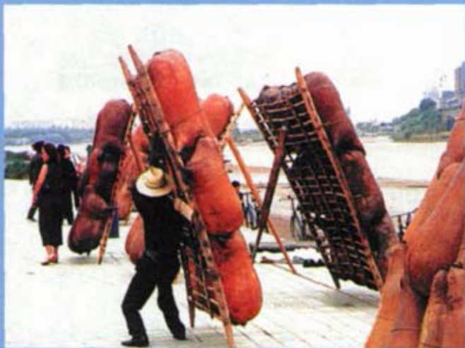
古老的羊皮筏子也为旅游业的兴旺出力