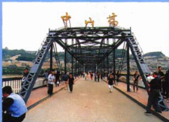
百年铁桥终于退休，成为休闲的步行桥