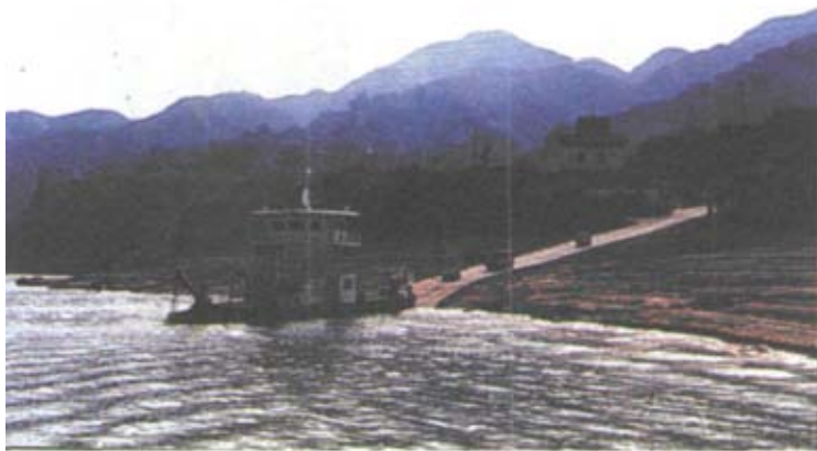
位于刘家峡水库上游的黄河古渡

除金城古渡外，历史上横渡黄河、进入河西的丝路古渡还有数处，多在南距兰州数十公里处的靖远县境内，这里也是西汉设立金城郡时最初的郡治所在地。沿着东北距兰州80公里、建于黄河上游的第七