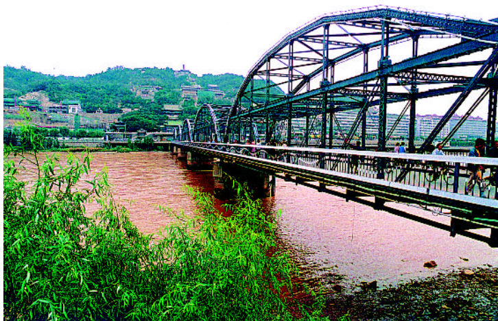
飞架在兰州黄河古渡口的“天下黄河第一桥”

金城兰州位于皋兰、白塔两山之间的黄河冲积扇上，是丝绸之路主路东西往来的必经之地。由天水、会宁方向过来的旅人，经过金城，一是过黄河向北，经青海湖由扁都口进入河西走廊张掖地区，或经格尔木进入新疆南部；更多的人则是从金城渡过黄河，翻越乌