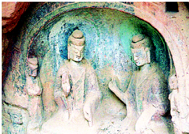
被世俗化的炳灵寺佛雕

上，湖水荡漾，蓝天白云。两岸奇峰对峙，壁立千仞；一路山清水秀，峰险石奇。间或杂有大片的农田、待收的庄稼，此外还有水边的古渡、山头的烽燧等，让人不胜遐思！乘坐游艇两个小时左右即可抵达石窟码头。沿着大寺沟口前行，可见两座比肩而立被称为“姊妹峰”的天然石峰屹立在沟口，眺望着黄河上下，守护着沟内的炳灵寺石窟。它们为炳灵寺增添了灵气。