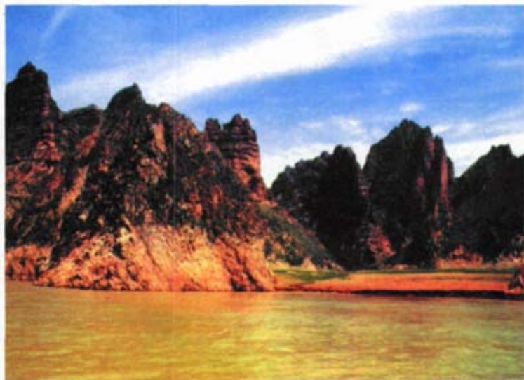
黄河上游风景如画

炳灵寺石窟所在地，是丝绸之路和唐蕃古道交汇之处。石窟始建于佛教盛行的十六国西秦时期，在169窟第6龕发现的“建弘元年（420）”题记，说明至少在十六国西秦时期，炳灵寺石窟就具有了相当的规模。在此后的1600年里，炳灵寺石窟经过不断开凿，一度成为中西文化融合与传播的一个重要驿站。石窟内保存有中国最早的维摩像、净土龕、释迦多宝像、弥勒佛立像和十方佛像等，在中国早期石窟佛教的发展和传播中占据了重要地位，奠定了炳灵寺在中国佛教史研究中的重要地位。该寺现存窟龕183个，石雕694尊，石