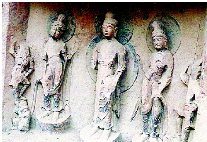
精美的炳灵寺佛雕