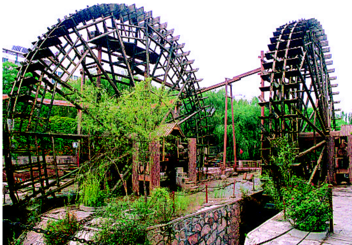
见证了黄河两岸兴衰的黄河水车也成为今天的旅游景点

搏击风浪的雄姿，倾听他们发自内心深处的吟唱。古老的羊皮筏子在悠悠的历史长河中漂浮，直到近代，它们都还在黄河上发挥着作用。抗日战争期间，四川等地曾用羊皮筏子从长江上给中国军队运送军用汽油。1949年，数万解放大军也是靠羊皮筏子渡过黄河，进军青海。20世纪50年代，羊皮筏子仍然是黄河上游水上交通的主要运输工具，后来随着公路的贯通和桥梁的增加，羊皮筏子才逐渐退出它占据了2 000多年之久的历史舞台，但在偏远