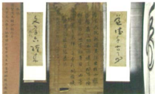
龙泉苑展出的部分书法作品