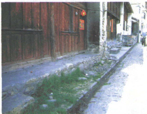
老街上曾经繁华的店铺

古西南丝绸之路，古称“蜀(四川)身毒(印度)道”，从四川成都地区出发，经云南向缅甸、印度、巴基斯坦而至中亚，是古代历史上一条重要的国际商道，距今已有2000多年的历史。古西南丝绸之路承载着中原文明，联通域外，在大理境内与滇藏茶马古道交汇。从大理往北，茶马古道上丽江，过迪庆，进西藏；从大理往西，古老的西南丝绸之路经漾濞通往永昌，进入了它在国境内的最末一段——永昌道。永昌道出漾濞，过永平，因经过永平县的博南山，故又称博南古道。而漾濞，成为博南古道上的一个重要驿站。“汉德广，开不宾，渡博南，越南津，渡澜沧，为他人”的古歌谣，传唱着博南古道悠久的历史；而古道上依稀留存的众多驿站，诉说着古道曾经的人马喧嚣、热闹繁华。漾濞老街，想来便是那时漾濞境内最繁华热闹的驿站。