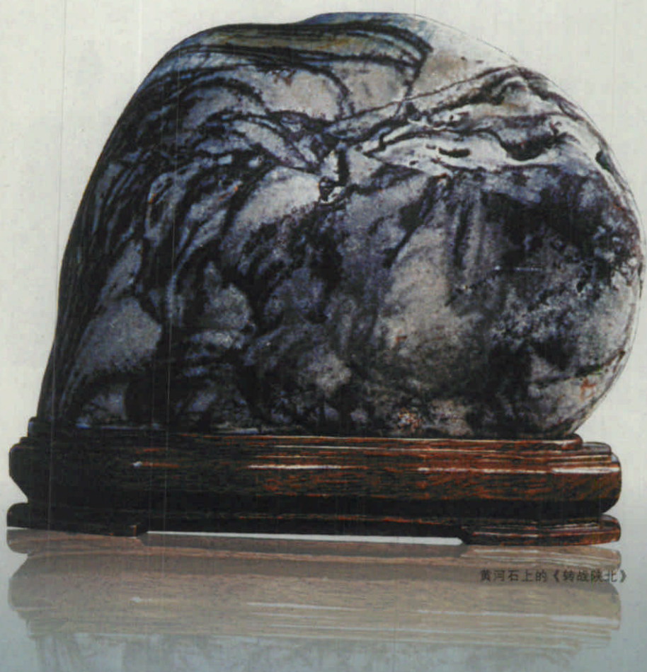
黄河石上的《转战陕北》