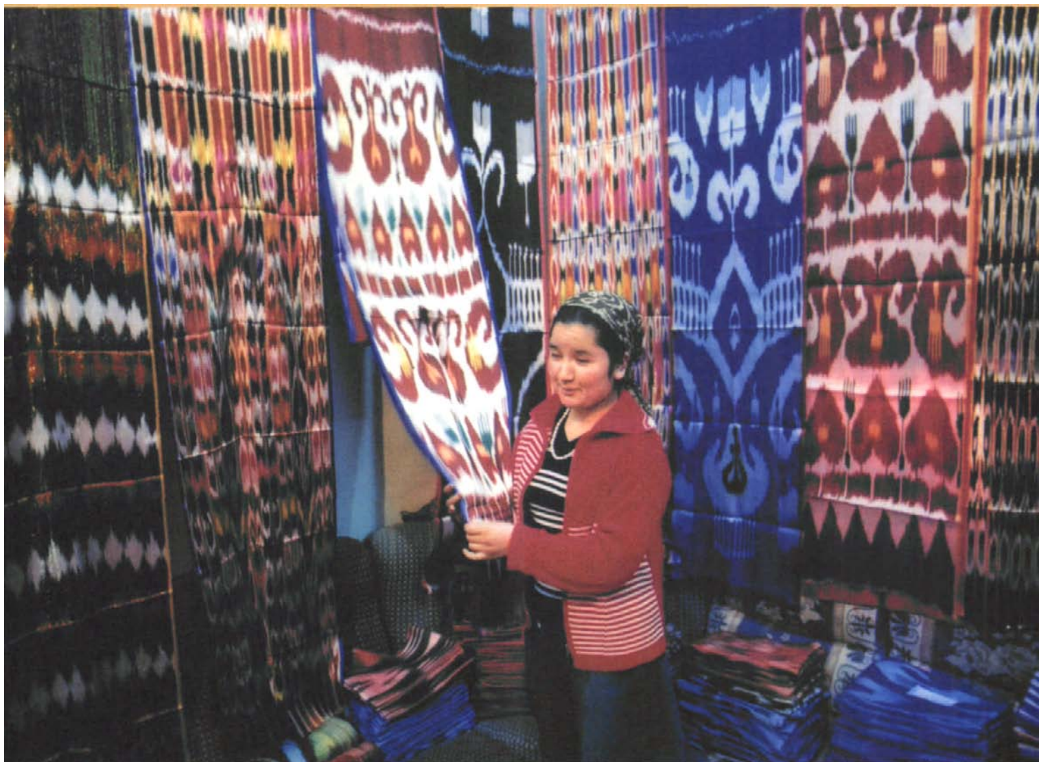
美丽的艾得莱斯绸寄托着维吾尔族妇女无尽的希望