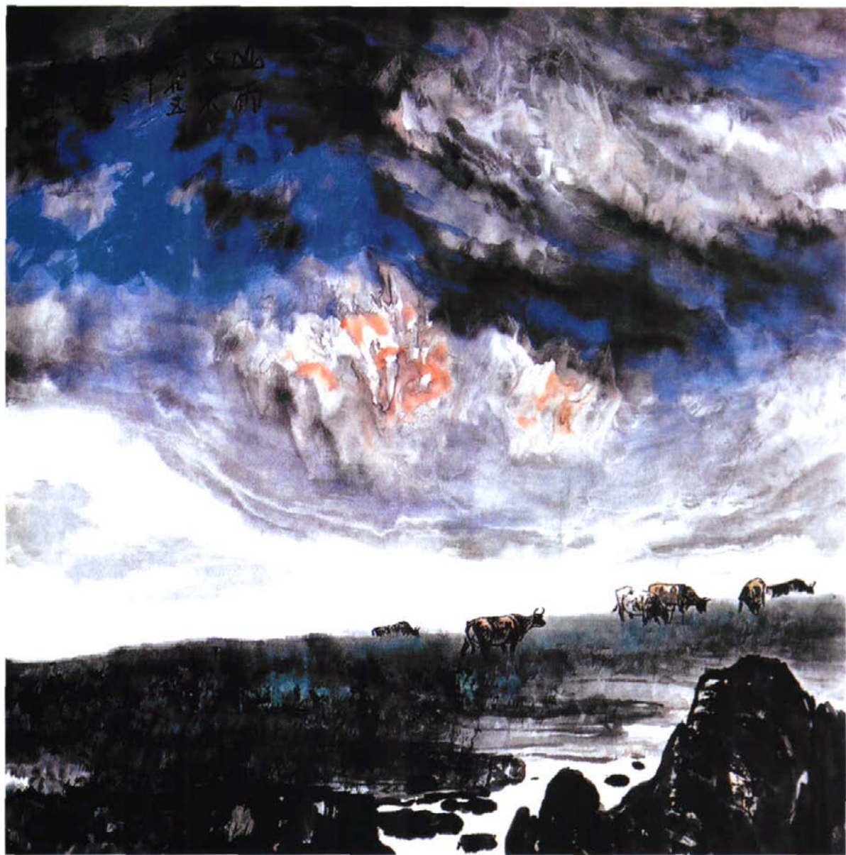
《山雨欲来》 89×86厘米 牧歌 作