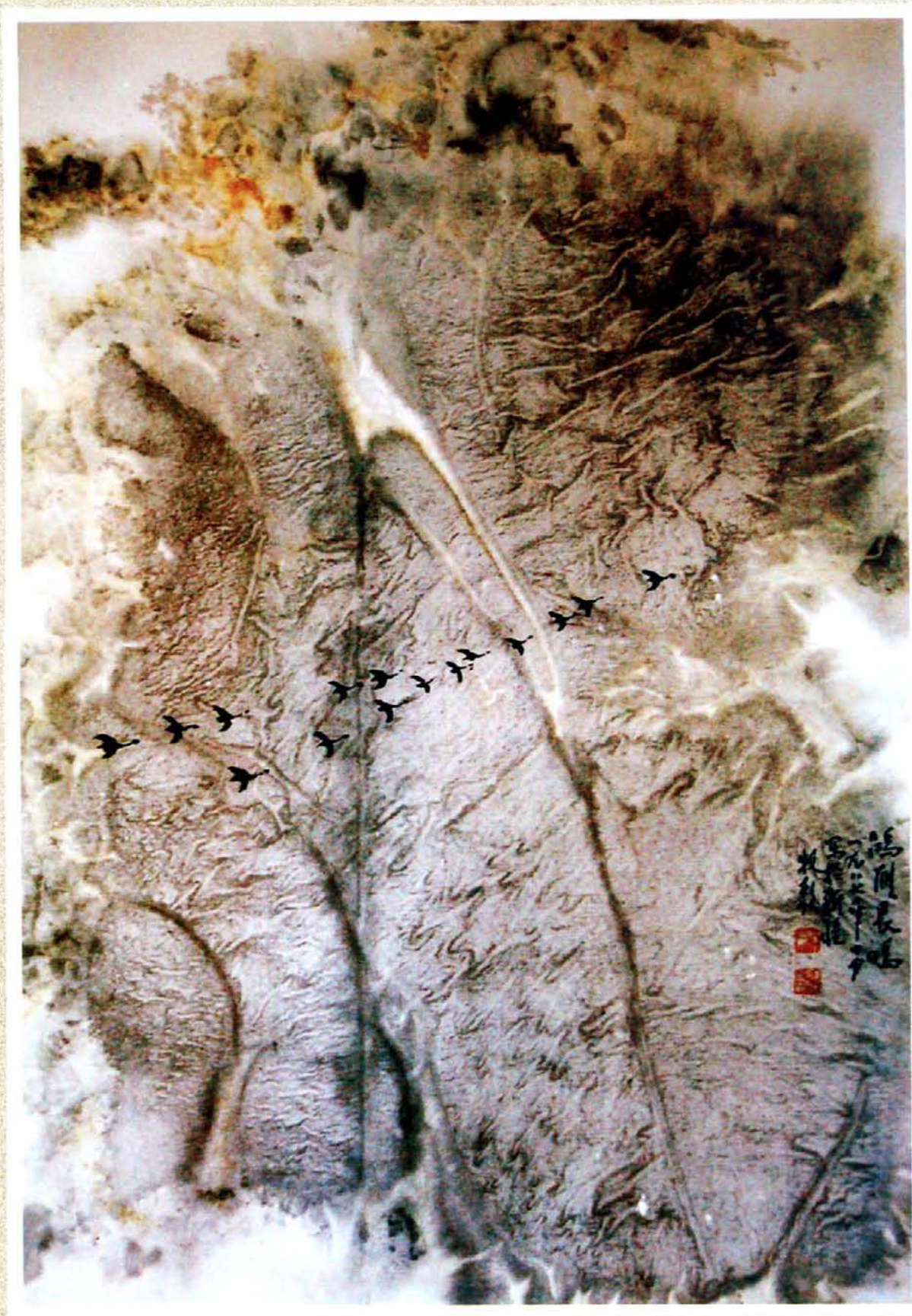
《鸿雁长鸣》48×67厘米 牧歌作