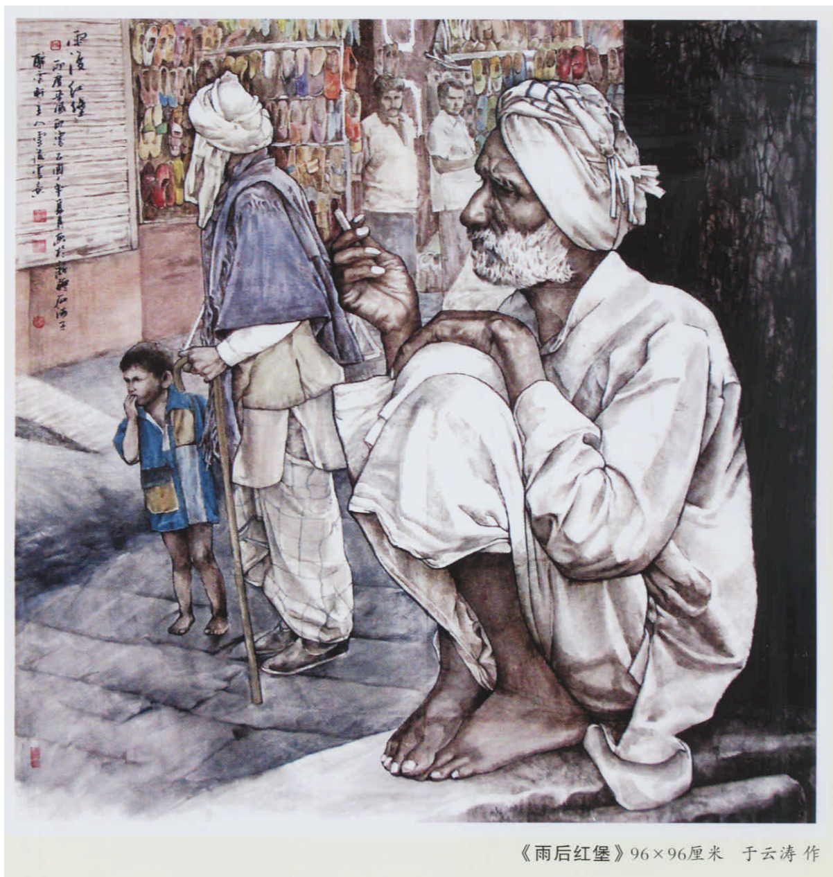
《雨后红堡》96×96厘米 于云涛 作