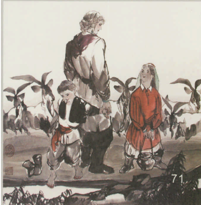
▼于云涛作品《清清水》