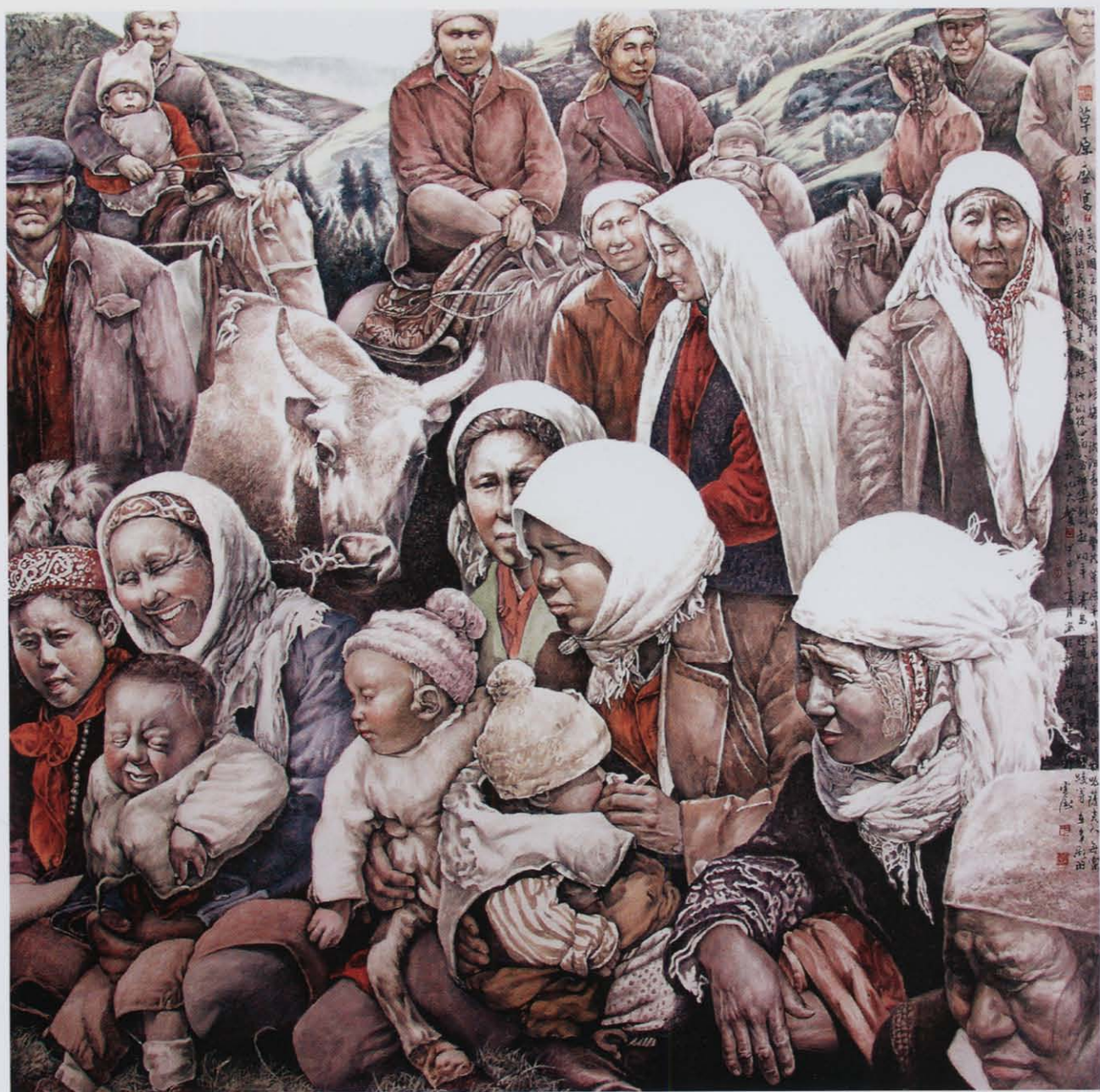
《草原盛宴》96×96厘米 于云涛 作