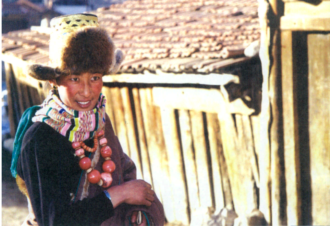
一位藏族妇女正在她家门口笑迎远道而来的客人

相映生辉。这里又是黄河水系和长江水系的分水岭，白龙江穿流而过，全镇植被完好，牧草丰茂，草质优良，属纯牧区。