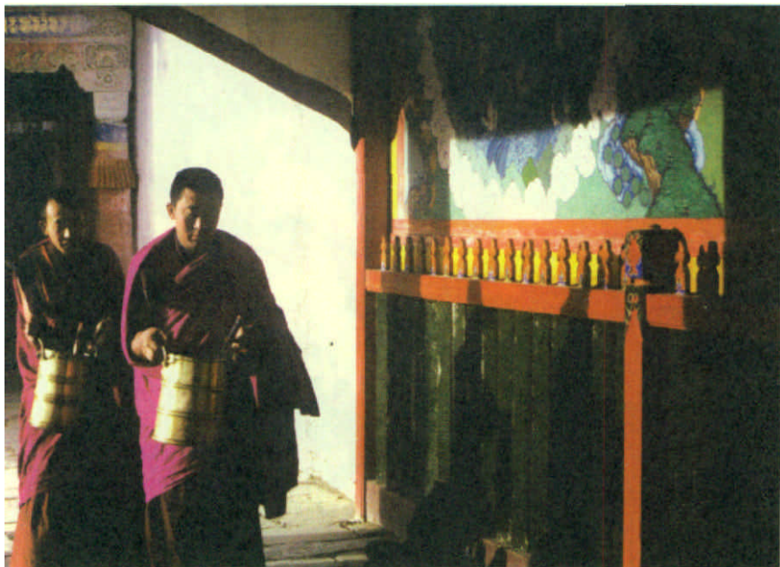
两位年轻喇嘛给大殿众僧送早粥

郎木寺镇地处甘、青、川交汇之地，是甘肃省甘南藏族自治州碌曲县下辖的一个小镇。该镇之北属甘肃的安多达仓郎木寺，镇之南是属四川若尔盖的格尔底寺，镇上还建有一清真寺，三寺各居一方，集于一镇，各自以不同方式承载着对信仰的虔诚和执著。