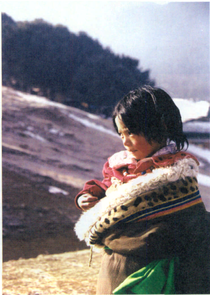
冬日的朝拜路上，一位藏族小姑娘凝目远眺

郎木寺的确是一个静谧、神奇、祥和、富有浓郁宗教色彩和独特地域特点的小镇。这里居住着藏、回、汉等民族，藏传佛教和伊斯兰教色彩浓厚，建有色止寺、晒佛台、白塔、天葬台等。每年的不同时日，都要举办盛大的宗教活动和民族文化活动。近几年，随着当地旅游事业的发展，越来越多的中外游人和艺术家来到郎木寺观光、采风。人们称这里是“东方小瑞士”，郎木寺已成为西部一隅很有名气的小镇。