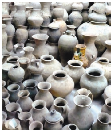
广河县博物馆的彩陶罐