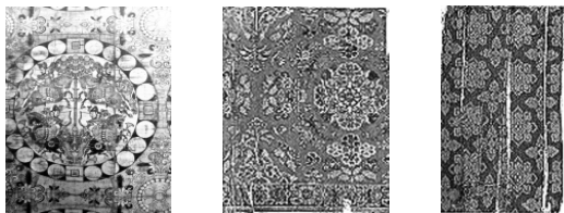
图3 联珠纹锦 图4 红地花鸟纹锦 图5 蓝地宝相花纹锦

朵团花。另外团花本身也以镜像、错位的对称方式排列,构图工整。为了避免单调,在团花的四边与安排穿插四簇花枝和飞鸟,打破对称的形式,给画面赋予新的活力。