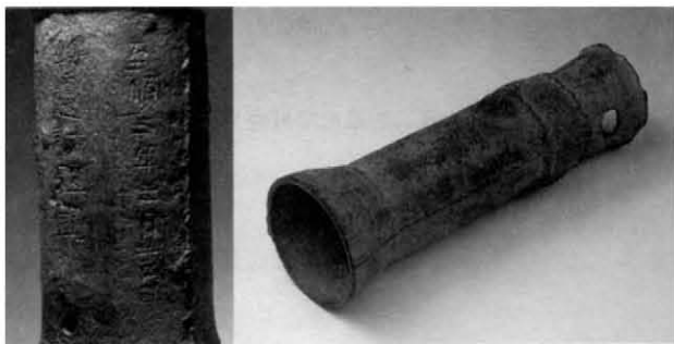
元至顺三年（1332年）铜炮，系现存有纪年可考的最早火炮（中国国家博物馆藏，选自《文物宋元史》）