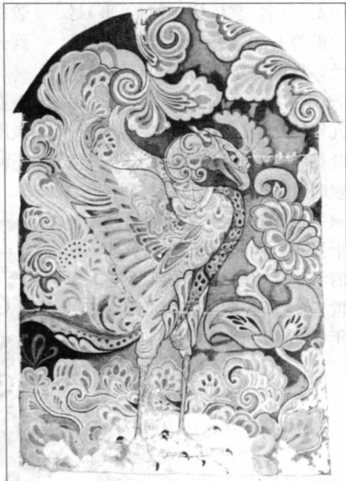
吐谷浑棺板画图案之朱雀。吐谷浑棺板画上的朱雀、玄武、玉兔等图案均是吐谷浑主动吸纳汉文化的结果。

唐太宗继位后,吐谷浑主伏允年老昏庸,行事乖张,他一方面不断派使者入唐,维护已建立的通贡和互市关系;另一方面又屡屡出兵,频繁扰掠唐西部边境,阻梗西域通道。唐太宗对伏允采取以安抚