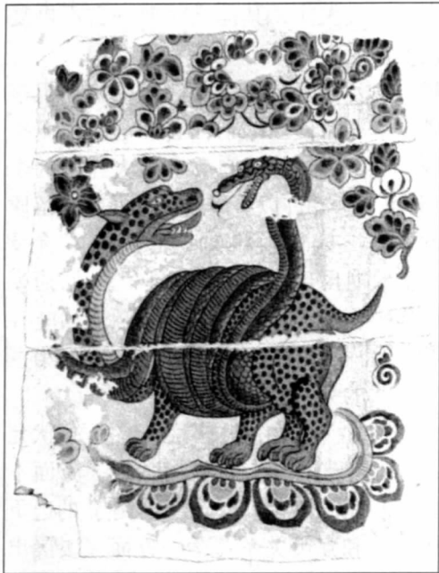
吐谷浑棺板画图案之玄武。 柳春诚 摹

的一道屏障。这年年底,诺曷钵入长安觐见,并向唐朝请婚。唐太宗答应以宗室女弘化公主往嫁。诺曷钵年年向唐王朝遣使进贡,双方来往十分密切。贞观十四年(640年),诺曷钵与弘化公主隆重完婚,唐浑关系更加亲密友好。