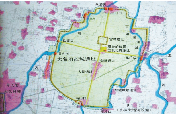
图2 大名府故城遗址图

平面布局。故城遗址的四十八里京城城墙基址已勘探定位，准确标界了外城城周基址、各城门位置、两水关的位置及遗存情况。经探测故城呈不规则形状，周长22.2公里，南北长6.8公里，东西宽5.7公里，面积约26.1平方公里，宫城居中，呈长方形。由于该城系一次性水毁，区内留存有丰富的文化层（图2）。