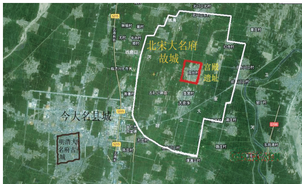
图1 北京大名府故城与今天大名县城的位置