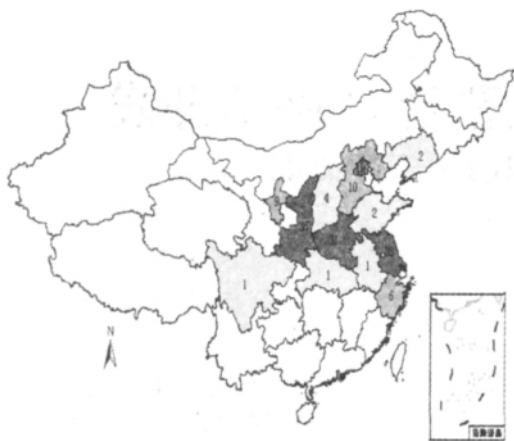
图 1 中国主要陵墓分布图