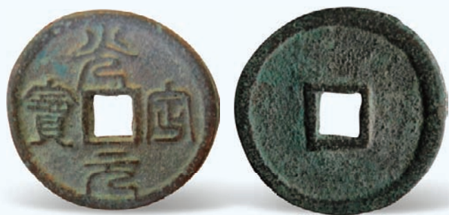
图11 光定元宝 铸期：神宗光定年间（1211—1223） 币质：青铜 特征：钱文篆书 小平型

细，形制规整，文字深峻，使用秀丽楷书（乾祐元宝行书是个例外），皇建、光定略有行韵。现在做的大安宝钱、贞观宝钱等伪品，形制规整，文字精好，而做的乾祐、皇建、光定等到伪品，虽极力求精求整，但也达不到真钱水平。西夏钱除铁