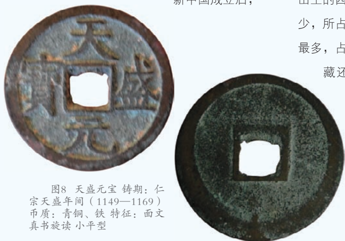
图8 天盛元宝 铸期：仁宗天盛年间（1149—1169） 币质：青铜、铁 特征：面文真书顺读 小平型

我国唐代和宋代金属钱币，具有极高科学性和极大实用性，一直影响了我国金属货币近两千年。西夏社会流通的主要是北宋钱币，为统一和方便，西夏铸币必然也要仿照唐宋钱制。如形制圆形方孔，币值小平、折二、折三，材质铜、铁并划分铁钱流通区域，钱文采用帝王年号和元宝、通宝、重宝等，都是仿照唐宋钱制。西夏在铸造钱币时，也融进独特的本民族文化，最突出的表现是在钱币上铸入本民族文字，使西夏文通过钱币，在国内得到传播推广和应用，也为我国钱币史上创造了独具特色的西夏文钱币。西夏铸造的钱币，总的说铜质精良，铸工高超，边廓坚挺，形制规整，字体端庄秀丽，书法高雅优美。《宋史·夏国传》载：南宋绍兴“二十八年（1158年，西夏天盛十年）始立通济监铸钱”。天盛十年距西夏建国已有120年，如按史册所载，西夏在