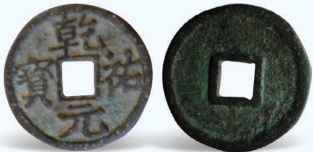
图10 乾乾元宝 铸期：仁宗乾乾年间（1170—1193） 币质：青铜 特征：小平型

西夏王朝使用的年号多，史籍又没有铸钱记载，而现在已发现确认的西夏钱币，很难确定就是全部品种，今后很有可能再出现新品种。这就给制造伪钱者有了空隙可钻，制伪者就可以造出各种西夏新品，以谋取高利。所以在确认西夏钱新品种的同时，要防止和剔除各种臆造的伪品。西夏文是一种多数人不认识和不使用的特殊文字，伪造的西夏文假钱，只能照样去描画字形，但描画出来的西夏字，往往失去神韵，有的甚至于连笔画也描写不对。因此对西夏文钱，要请教懂西夏文的人去辨识，或以已熟悉的西夏文去对照辨认。西夏钱币前期铸造和后期铸造不太一样。前期（元德之前）铸造的钱币，铸工粗疏，形制不整，文字浅显。除元德重宝外，西夏文使用行书、草书（不规矩的行书），汉文隶书或隶楷混书；后期铸工精