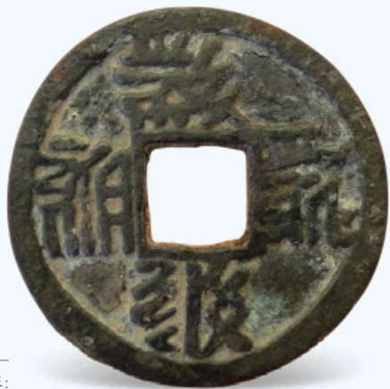
图1 大安宝钱 铸期： 惠宗大安年间（1075— 1085）币质：青铜 特征： 面西夏文 偶见背月

西夏王朝在历史上存在了190年，社会上流通的货币，主要是北宋和以前朝代遗留下来的钱币。作为政权国家的象征和社会的实际需要，西夏王朝也铸造了本王朝的钱币，但数量较少。已发现西夏铸币计有十多个种类。