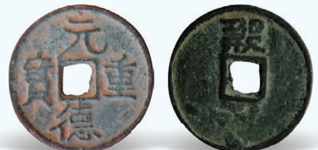
图6 元德重宝 铸期：元德年间（1120—1126） 币质：青铜 特征：小平型 制作精美