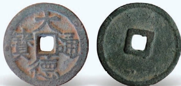
图7 大德通宝 铸期：崇宗大德年间（1137—1139） 币质：青铜 特征：真书顺读 小平型

文形式独特、史籍不载和传世数量稀少而称著于世。研究西夏钱币是新兴的西夏学科的重要内容，也对发展我国钱币学、丰富我国货币文化具有重要意义。