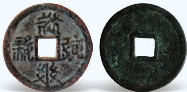
图9 乾乾宝钱 铸期：仁宗乾乾年间（1170—1193） 币质：青铜 特征：面西夏文 小平型

二十世纪80年代，随着改革开放政策的实施，古钱币收藏研究出现热潮，为利益所驱使，钱币作伪也泛滥起来。西夏钱币稀少价高，更成了一些人谋利作伪的重灾区。西夏钱币和历代钱币一样，有其共同点，也有其不同点，其不同点就是它的特点。了解西夏钱币的特点，就能较为顺利地辨别它的真伪。