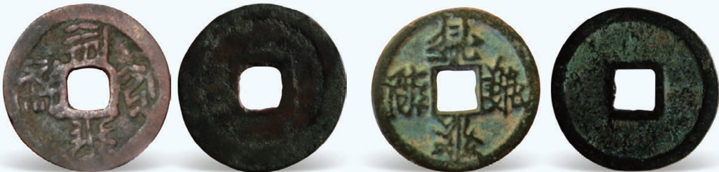
图2 福圣宝钱 铸期：毅宗福圣承道年间（1053—1056） 币质：青铜 特征：面西夏文 小平型 风格粗犷