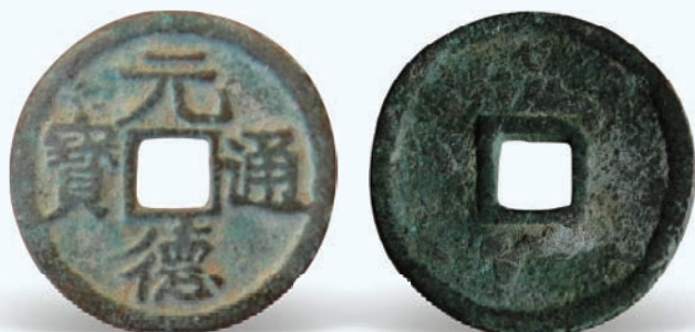
图5 元德通宝 铸期：崇宗元德年间（1120—1126） 币质：青铜 特征：面文隶、楷书