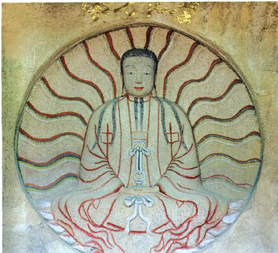
图二 草庵摩尼光佛石雕像

的美感。佛身高154、宽83、深11厘米；头部长32、宽25厘米。摩尼身着无扣广袖僧衣，襟结下垂扣上圈饰，再套在脚部蝴蝶结，然后向两下垂，结跏趺坐莲花座上，有襟结下垂作蝶形，双手叠放在盘腿上，掌心向上，法相庄严，衣裳简朴。留有长发，发梢垂于双肩，方脸薄唇，弯眉隆起，下额无突，大耳垂肩，嘴角两线深显，颌下两撮长须下垂。脸部圆润呈淡青色，手部呈粉红色，服饰为灰白色，如天造地设；雕像背后刻十八道波线状佛光纹。该雕像雕工精致，风格独特，世称摩尼光佛，是研究福建外来宗教的珍贵文物。