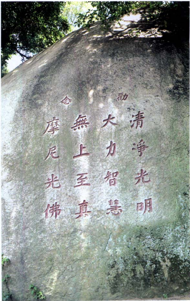
图三 摩尼教偈语摩崖石刻

明初，太祖朱元璋依靠明教夺取政权，采用明教的“明”厘定国号。但又担心其教义“上逼国号”，威胁他的统治，于是乎“擒其徒，毁其宫”。所以极盛一时的明教不得不转入秘密活动，逐渐被道教、佛教和民间崇拜所融合。草庵寺前约40米处的一座摩崖上阴刻着四竖行18个楷书大字：“劝念：清净光明，大力智慧，无上至真，摩尼光佛”，字径63厘米（图三）。下款刻“正统乙丑年九月十三日，住山弟子明书立”。正统乙丑年即为正统十年（1445），这时距雕刻元代草庵寺的摩尼佛像已100