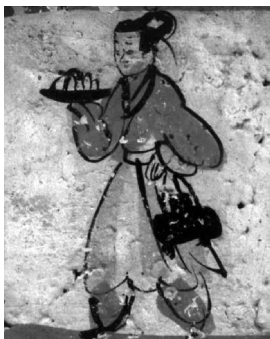
图3 嘉峪关墓室壁画 《进食图》