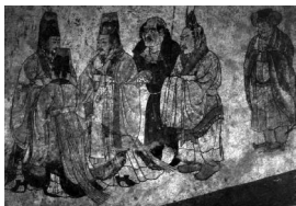
图6 [唐]章怀太子墓墓室 壁画《礼宾图》