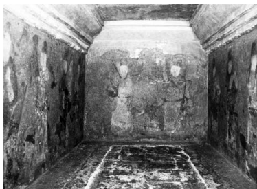
图9 渤海国贞孝公主墓壁画