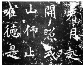
图2 北魏《张猛龙碑》石刻被誉为魏碑第一

崇”,“结构精绝,变化无端”。碑文书法用笔方圆并用,结字长方,笔画虽属横平竖直,但不乏变化,自然合度,妍丽多姿。