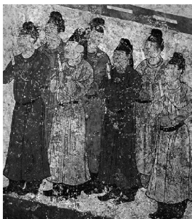
图7 [唐]《男侍从图》 李重润墓壁画

中,因此,出现了文人的专业画家。经过南北朝时期,随着佛教的传入,又吸收了某些外来艺术表现手法,产生了更为成熟的唐代绘画。 [1]