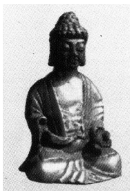
图8 渤海国出土的铜佛造像