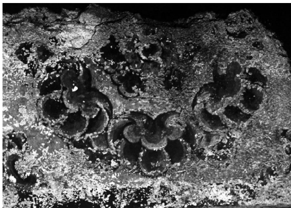
图10 渤海国三灵坟墓室壁画

坟一带为渤海国王陵区所在,三灵坟为整个区内的一个墓葬。墓地背山面水,隔牡丹江南岸约4公里为渤海国上京龙泉府。