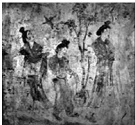
图5 [唐]章怀太子墓墓室 壁画 《女侍·观鸟扑蝉》