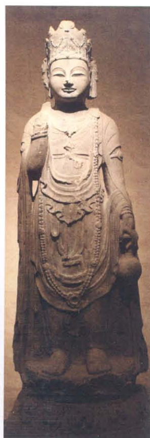
图版 4 西安市北郊未央公社张家巷出土石造菩萨立像