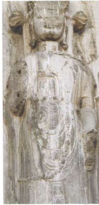
图版 15 云门山石窟第 2 龕左胁侍菩萨立像