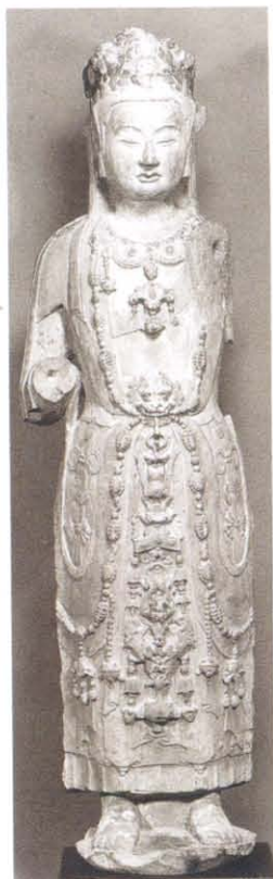
图版 21 克利夫兰艺 术博物馆藏菩萨立像