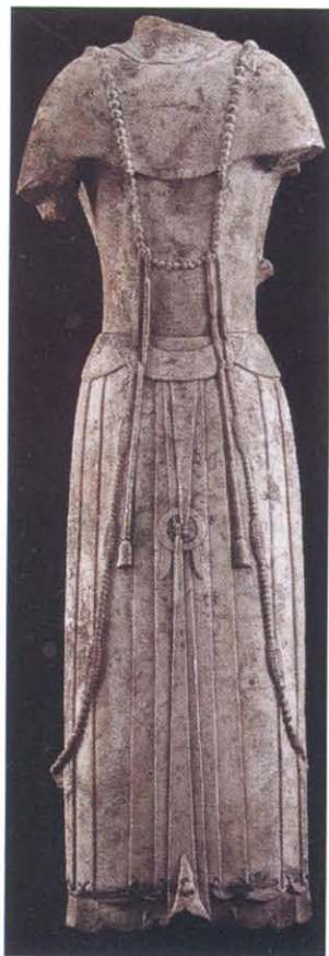
图版 25 曲阳修德寺 址出土菩萨立像背面