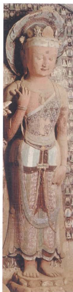
图版 7 敦煌莫高窟第427窟北壁左胁侍菩萨立像