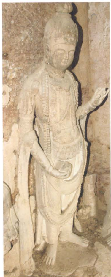
图版 9 麦积山石窟第 62 窟正壁左胁侍菩萨立像