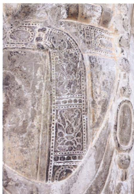
图版 34 云门山石窟第 2 龕胁侍菩萨立像扣环