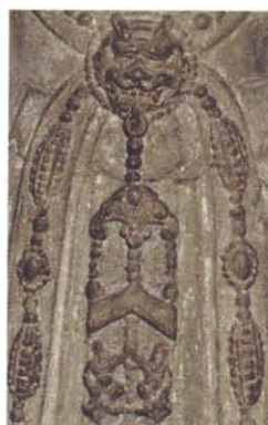
图版 27c 哈佛大学博 物馆藏菩萨立像佩玉