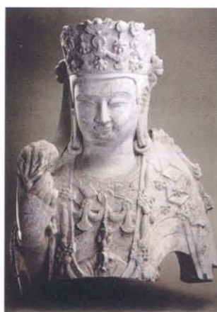
图版 6 礼泉寺遗址出土菩萨像