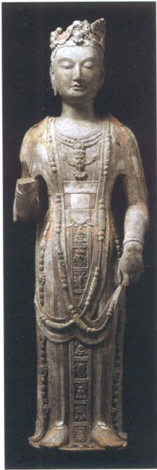
图版 13 青州市龙兴寺址窖藏出土菩萨立像