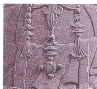
图版 28b 诸城市窖藏 出土菩萨立像铃状饰物