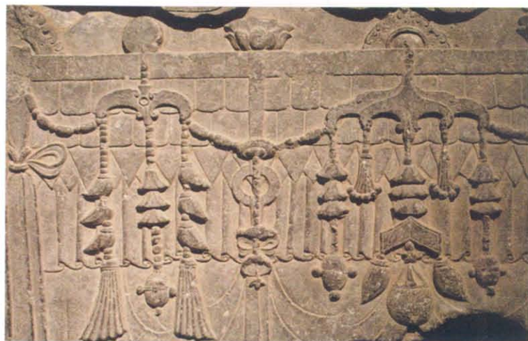
图版 30 河南博物院藏北齐武平 7 年(576)铭安始兴造像碑