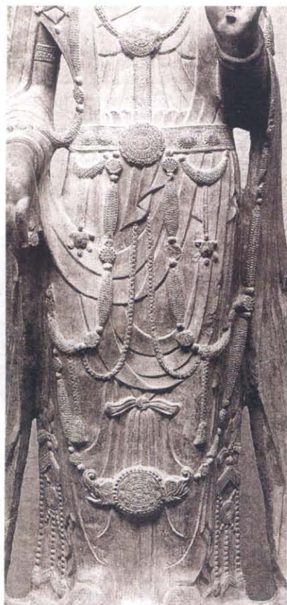
图版 2 波士顿美术馆藏石造菩萨立像部分