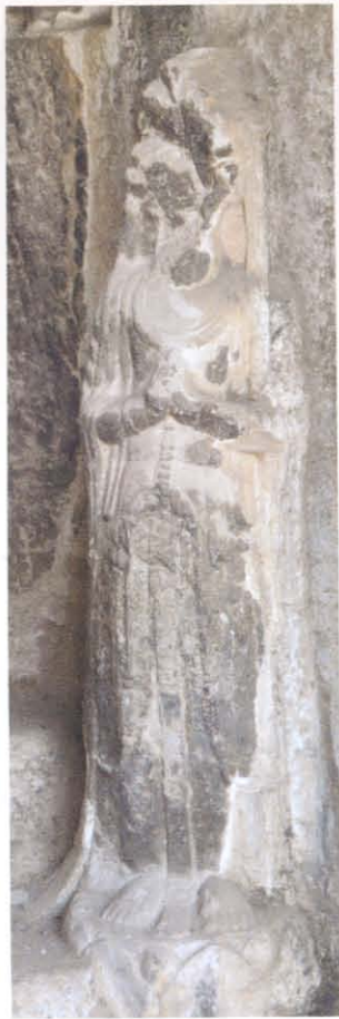
图版 18 驼山石窟第 5 窟左胁侍菩萨立像