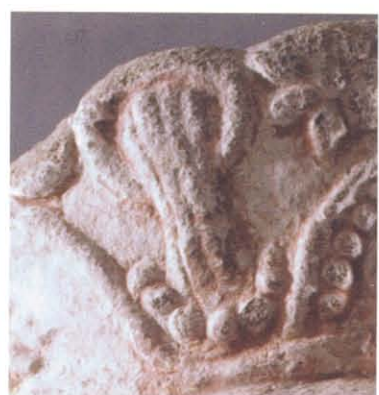
图版 29a 天龙山石窟第10 窟交脚菩萨像宝冠串穗饰物