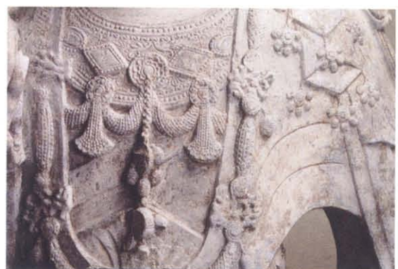
图版 29b 礼泉寺遗址 出土菩萨像串穗饰物