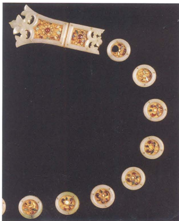
图版 35 长安县南里五村窦唐墓出土带饰