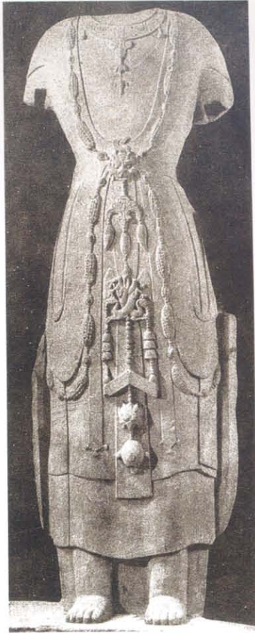
图版 19 山西博物馆藏菩 萨立像