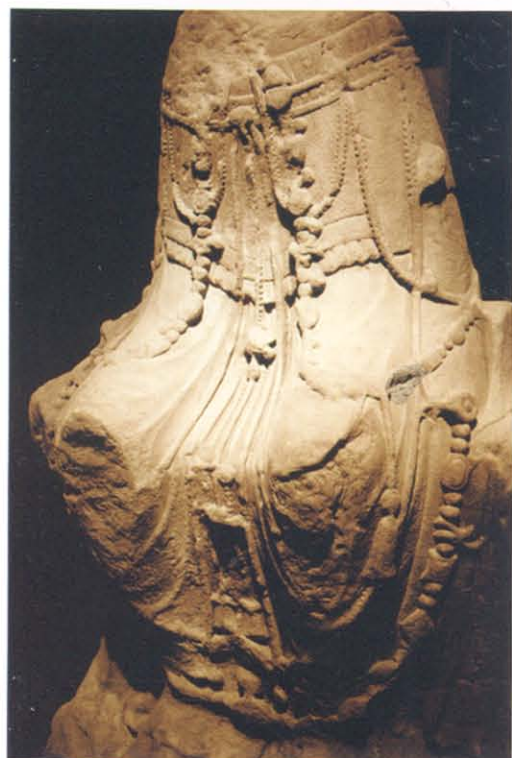
图版 31 成都万佛寺址出土北周天和 2 年(567)铭菩萨倚坐像