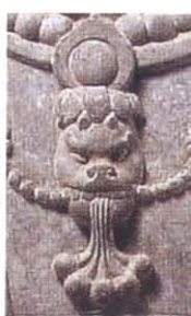
图版 28e 敦煌莫高窟 第244窟北壁左胁侍 菩萨立像串穗饰物