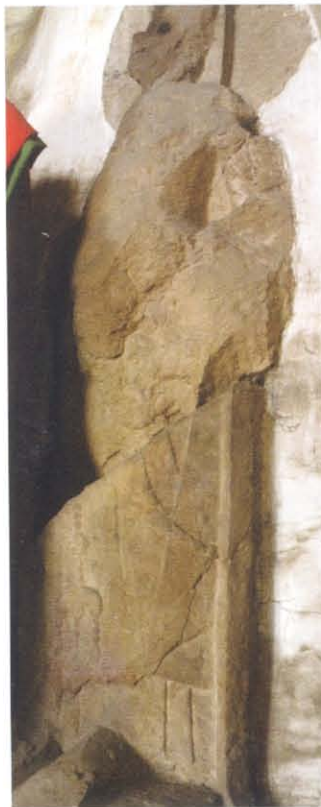
图版 23 平定县开河寺开 皇元年铭左胁侍菩萨立像