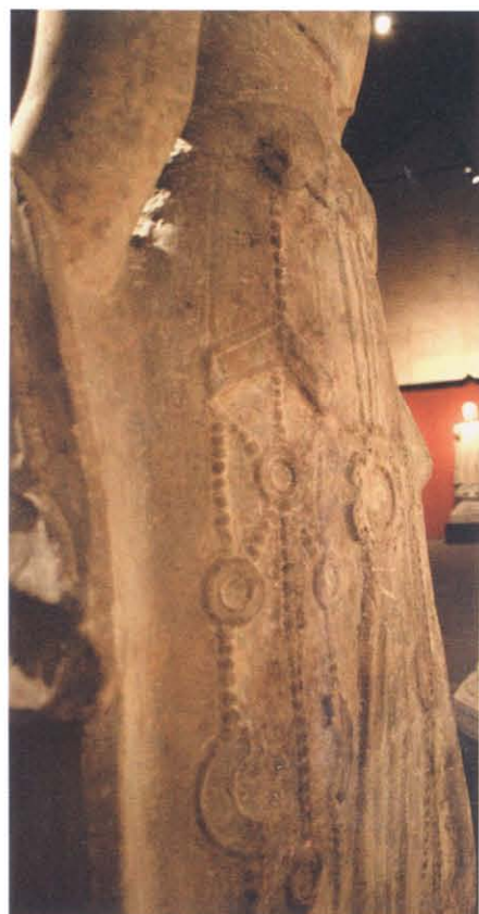
图版 5 西安市北郊未央公社张家巷出土石造菩萨立像背面