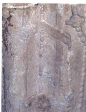
图版 27d 博兴龙华寺 出土菩萨立像佩玉