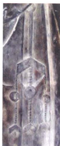
图版 27a 西安周边出土 菩萨立像佩玉(衡)