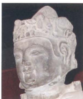
图版 33 西安市北郊未央公社张家巷出土石造菩萨像头部