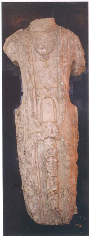
图版 17 济南市县西巷 开元寺址出土菩萨立像