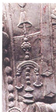
图版 27b 诸城市窖藏出土 菩萨立像佩玉(璜)