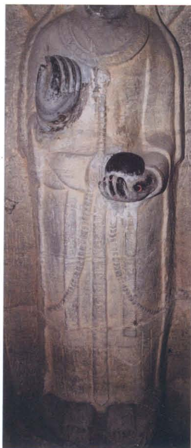
图版 26 宝山大住圣窟弥勒 佛胁侍菩萨立像