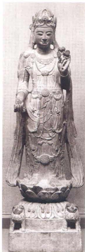
图版 1 波士顿美术馆藏石造菩萨立像