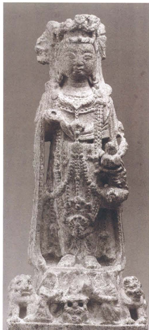
图版 32 开皇 16 年铭观音菩萨立像