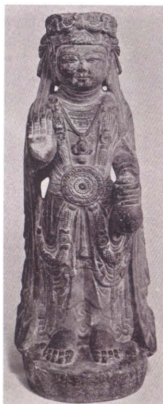
图版 28a 西安周边出土 北周菩萨立像铃状饰物