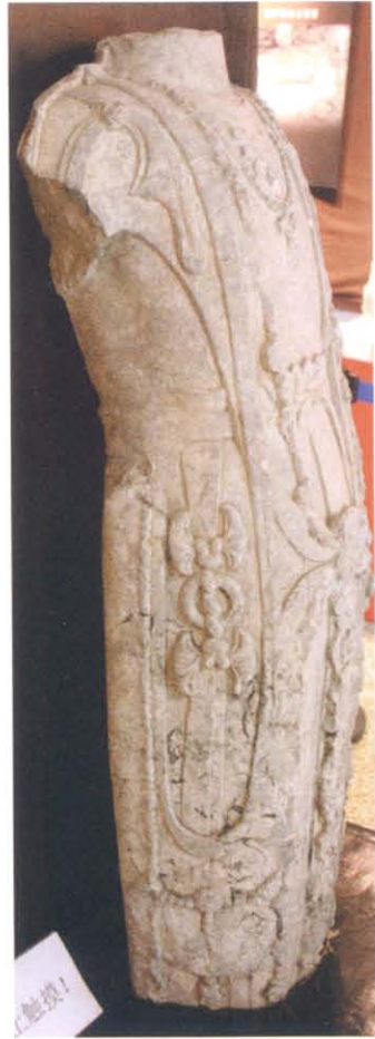
图版 16 济南市县西巷开元寺址出土菩萨立像