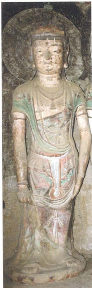
图版 10 麦积山石窟第 5 窟正壁右外侧菩萨立像