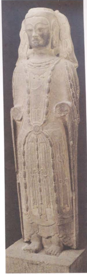
图版 20 平遥县岳壁 村出土北齐菩萨立像