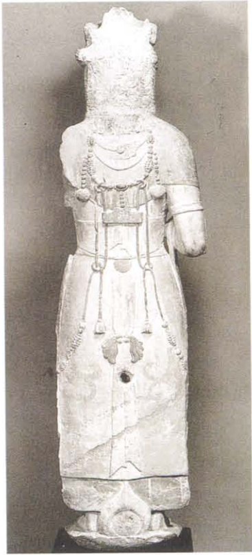
图版 22 克利夫兰艺术博 物馆藏菩萨立像背面