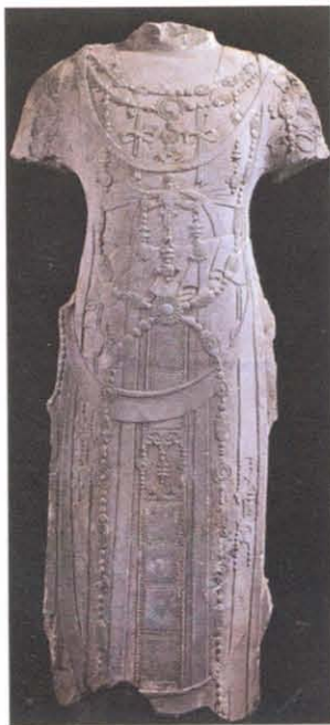
图版 12 诸城窖藏出土菩萨立像