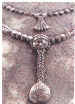
图版 28c 曲阳修德寺址 出土菩萨立像铃状饰物