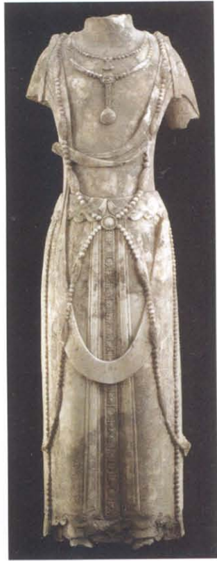
图版 24 曲阳修德 寺址出土菩萨立像