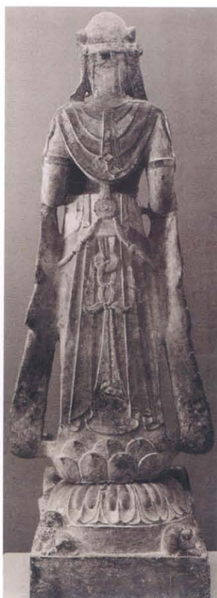
图版 3 波士顿美术馆藏石造菩萨立像背面