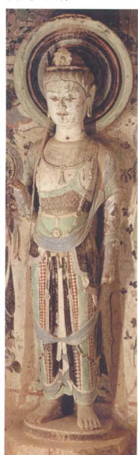
图版 8 敦煌莫高窟第241窟北壁左胁侍菩萨立像