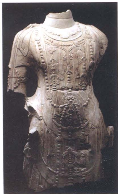
图版 11 诸城窖藏出土菩萨立像