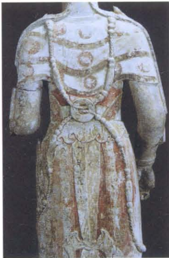
图版 14 青州市龙兴寺址窖藏出土菩萨立像背面