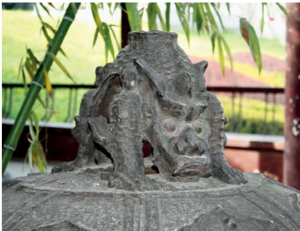
图二 幽冥钟上的蒲牢钩手

指按照清朝奖励官员的议叙制度，庄刚所得到的考核成绩。议叙是指清代官吏经考核有绩者，交有司核议，以定功赏之等级的一种制度。议叙的方法分为两种，“一加级，二记录：自记录一次至记录三次，其上为加一级；又自加一级记录至加二级，加二级记录一次至加三级，凡十二等” [5] 。根据铭文所知，庄刚的记录达二十四次，在官吏中应属比较好的成绩。