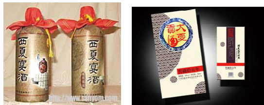
图3 西夏宴酒、大夏贡窖藏十五年