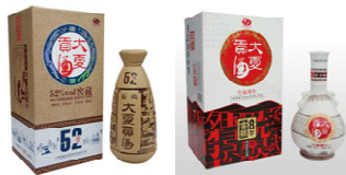
图1 大夏贡窖藏年份酒

色彩是酒类包装设计的一大主题，它是对人们视觉上的刺激，从而在客观上决定了白酒的产品的形象，所以色彩设计十分重要。色彩设在充分装饰酒类的同时，也恰到好处的做了酒类的说明书。如宁夏大夏贡窖藏年份酒(如图1)的外包装设计采用了西夏时期的黑、白、褐三基色，辅以红、蓝、黄等色彩，将西夏文字和中国的龙凤图腾大胆演绎、匠心独用，在色彩中实现了中国传统酒文化、西夏文化与现代人们对品质、健康、时尚元素追求的完美融合。