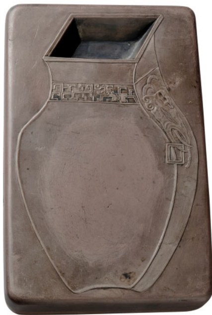
图2 宋代何玉融铭太平有象端砚

太平有象传统造型多为一象一瓶。一只硕大、憨态可掬的大象，背搭锦袱，上驮一宝瓶，有的还加上人物和一些饰件。例如清代康熙年间石雕名家、福建漳浦人尚均，用寿山白芙蓉晶，雕制一个太平有象摆件。大象圆浑而灵动，小童持宝瓶匍匐于象背，老象奴蹲于神象下侧，手持象钩，持重老成，一老一少各具个性又相顾有情。整件作品洁莹、神圣、华美，令人赞叹不已。又如景泰蓝第一位中国工艺美术大师张同禄独出新意，以“天子驾六”的最高规格，六象齐出，创作出六头白象分列六方，共驮六瓣瓜纹宝瓶的巨制大作，气度非凡，华贵富丽，在北京工艺美术大厦展出，万众围观，轰动全国。这些艺术品巧夺天工，造型雅致，形象生动，光彩逼人。但如果套用它们的形态制