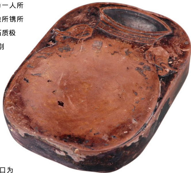
图6 清代太平有象椭圆端砚

其五，清代太平有象椭圆端砚（图6），长13厘米，宽9.3厘米，厚2厘米。砚面浅浮雕一花瓶，瓶底和砚面后边线重叠。瓶身为砚堂，中间下凹。瓶口橄榄核形，下凹深，为砚池。瓶颈饰回纹，两边侧各伸出一象头，瞪眼垂耳，翘牙卷鼻，形象生动活泼。背平，有边框，内阴刻行楷：“四月清和雨乍晴，南山当户转分明”，落款“雪山道人”。全砚紫红色，石质腻滑。背有缺损，墨汁渗入，古意盎然。