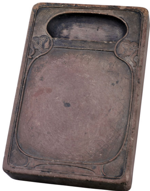
图1 清代太平有象长方端砚

我有多方太平有象砚。太平有象纹也常见于石雕、木雕、绘画，多用于窗棂、家具、屏风、铜器、瓷器上的装饰。这一吉祥图案由象和宝瓶组成。