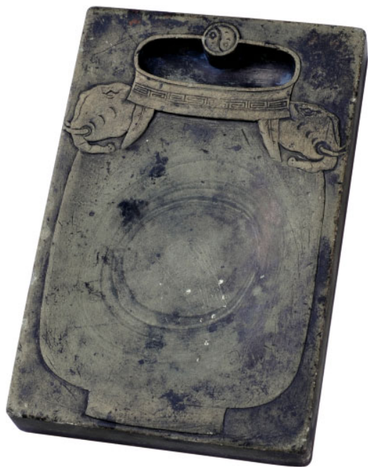
图4 清代太平有象长方祁阳石砚

砚，则事与愿违，不但违背传统砚形，又无法磨墨舔笔。制砚家们匠心独运，因势而变，以象头代表神象，设计出瓶身为砚堂，瓶口为砚池，象头长鼻为瓶耳的太平有象砚。传统形制未变，吉祥寓意已在。这些砚台形式多样，有的长方，有的椭圆，有的就是宝瓶样，但都不失文房之砚的格调，“瓶”、“象”的基本元素又全具备。现将我收藏的五方太平有象砚分述如下。