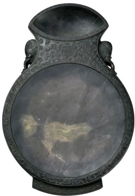
图5 清代太平有象宝瓶端砚