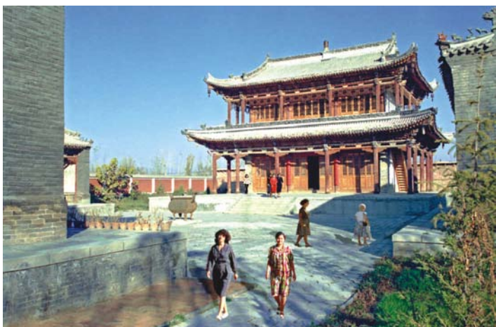
靖远寺庭院内的三世佛大殿

穿过天王殿，路中立有一尊生铁铸的狮形大香炉，中央有一座单层木牌楼，上有光绪皇帝亲笔题的匾额。如来佛大殿中塑有如来佛像，两侧塑有宗喀巴以及其他许多千姿百态的铜质佛像。如来佛大殿后面两侧为配殿，东西殿为阎王殿，里面有喇嘛牌位及画像、六道轮回图，正门屋檐下的横隔木板上绘有《西游记》中的唐僧师徒取经图；西配殿为菩萨殿，内供许多菩萨，正门面额上谱写着修庙时捐银人的名字。最后是宏伟的三世佛大殿，为双层飞檐的琉璃瓦屋顶，下面顶壁下挂有12个大铁铃，东西两边各有一木梯，由此可登上二楼。一楼大殿内正堂供奉泥塑彩绘三世佛坐像，二层殿内存放着藏、