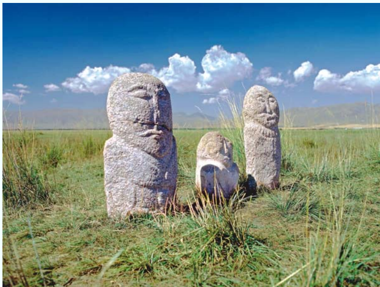
大小三个石人并排而立，像是一家人

与此相隔10余米处的一尊石人造型逼真，堪称艺术精品，令人难忘。身高2.3米，头宽35厘米，身宽50厘米，是用白色花岗岩雕刻而成。头上戴着一顶造型漂亮的帽子，背后披着长长的发辫，垂至臀部。我细细数了一下发辫，竟多至10条。可惜这尊石人的下颌和胸部有部分破损，但唇上还能分明看出尚存的八字胡右半撇，右手握酒杯贴于左胸，左手下垂握刀，腰下至腿处刻有