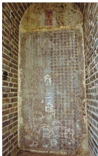
格登碑正面的碑文字迹清晰可辨

第二天我们一行从军马场出发，路经农四师76团再往西行，约两个小时就到了中哈边境线上。这里属丘陵地带。远远望见山头两处塔形建筑物，左边那座是格登碑，紧挨其右的是松拜站望塔楼。到了碑前，只见一座用砖砌起来的碑亭，有4米多高。这座碑是清乾隆二十五年（1760）由1000多官兵耗时一年多从2000多公里外的叶城县运到这里的。建碑的同时，还修建了木石结构的御碑亭，因年久失修，碑亭无存。1975年由国家拨款，用砖块将石碑夹砌起来。1984年国家再次拨款建起了现在的飞檐碑亭，并用钢筋栅栏围圈起来。正背两面设了铁门，平时铁门上锁。碑亭的旁边立了一块“自治区文物重点保护单位”的标志。2001年6月25日又被国务院批准为“全国重点文物保护单位”。石碑经过风雪侵蚀，碑文漫漶斑驳，但整个碑身仍完整无损，字迹清晰可辨。石碑高2.95米，宽0.83米，厚0.27米。碑额镌刻盘龙，正面盘龙上刻“皇清”二字，背面刻“万古”二字，均为朱色。碑座为日出