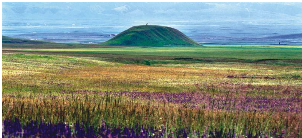
夏塔草原上巨大的土墩墓

在伊犁广阔的草原上分布着万座土墩墓。考古工作者曾挖掘了一底部周长200米、墓高10多米的大墓，估计封土堆的体积达1万多立方米，封堆中部的长方形墓室体积近100立方米，用木材近50立方米。不妨设想，将这1万座土墩墓一个一个排列起来，将连接千余公里，是一座多么浩大壮观的人类建筑，而当年在生产力很原始的情况下建构众多