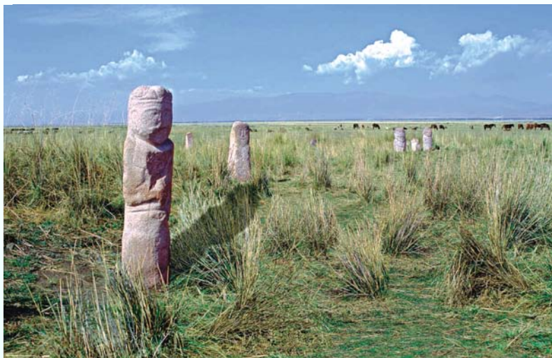
10余尊石人兀立在一望无际的大草原上，与星星点点的牛羊相伴

数十个古文字。从发辫看这尊石人应该是女性，但从尚存八字胡和左手握刀的造型看又似男性。后来查阅了有关资料才知道，这是一尊男性石人。《丝绸之路草原石人研究》一书中说，新疆目前发现的有发辫的石人都是男性石人。《大慈恩寺三藏法师传》记载，唐玄奘到西天取经路过叶城谒见统叶护可汗时，见“可汗身着绿绛袍，达官二百余人皆锦帽编发，围绕左右”。编发，即辫发，这说明突厥族男子是辫发的。我国考古学者根据其头戴冠的形式推测，该石人的身份及地位应该很高，可能是西突厥汗国内重要人物的雕像。这与日本学者研究其身上所刻文字得出的结论是一样的，即此石人很可能与西突厥阿波汗之孙利可汗的后裔有关，也就是说，这是一个西突厥王子的雕像。