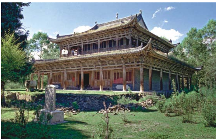
圣佑古庙院内的大雄宝殿

大雄宝殿是座古庙的主体建筑，殿宽17米，七开间，平面正方形，大出檐，高举折，陡顶，四角飞檐呈龙头探海之势，檐下斗拱，为多层桃仿肩架。虽然年久失修，镏金、油漆已大部剥落，但仍可看出原来雕梁画栋