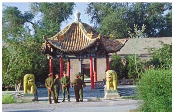
惠远古城里的将军亭在解放军某部驻地

延伸到8公里左右，成为当时新疆第一大城。城内建筑整齐，纵横四条大街，直通四个城门。每条街上都有小巷，共48条，城中心建有高大巍峨的钟鼓楼，以镇四方。我们绕行钟鼓楼一周，它共有三层，层层飞檐画栋。登楼远眺，满城风光尽收眼底，想当年，城内有宏大的将军府、参赞大臣衙署、领队大臣衙署，有从热河、凉州、庄浪等地迁调来的满洲、蒙古官兵以及各种军事设施。城内设有官办、私立学校10所，还有一所俄罗斯学校，沙俄帝国还在惠远设领职馆。另外还有清真寺、喇嘛庙、火神庙、关帝庙、真武庙、龙王庙、城隍庙、文晶宫、魁星阁、社稷坛、先农坛等建筑。那时的惠远城是何等的显赫！但随着政治中心往宁远（现伊宁市）的迁移，惠远后来仅成了驻军营地。经过百多年岁月的侵蚀，惠远城的所有建筑逐渐衰败和消失，只留下一座孤独的钟鼓楼。