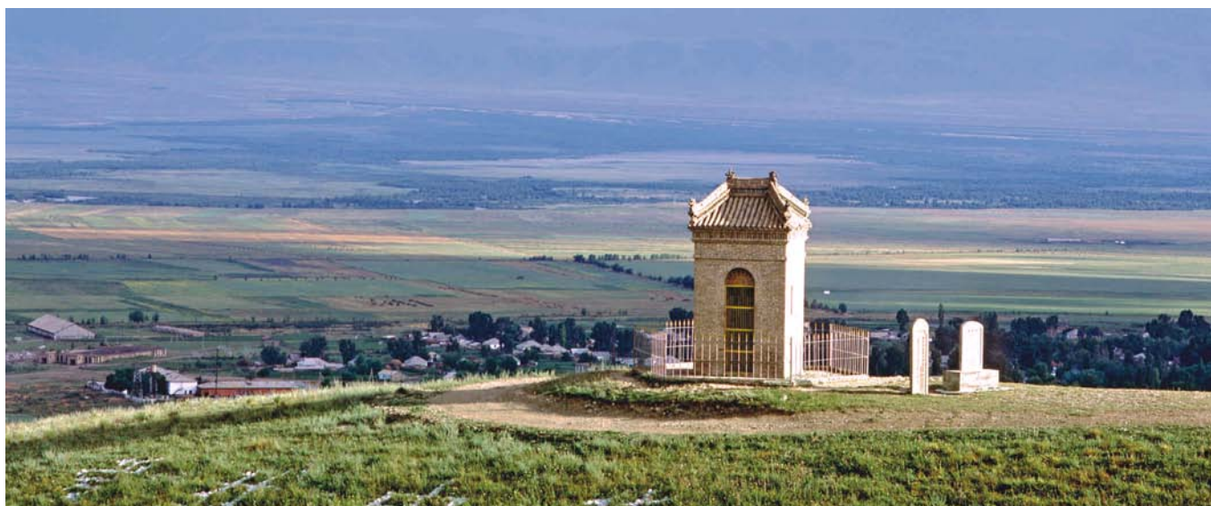
格登碑背后是哈萨克斯坦的一个集体农庄